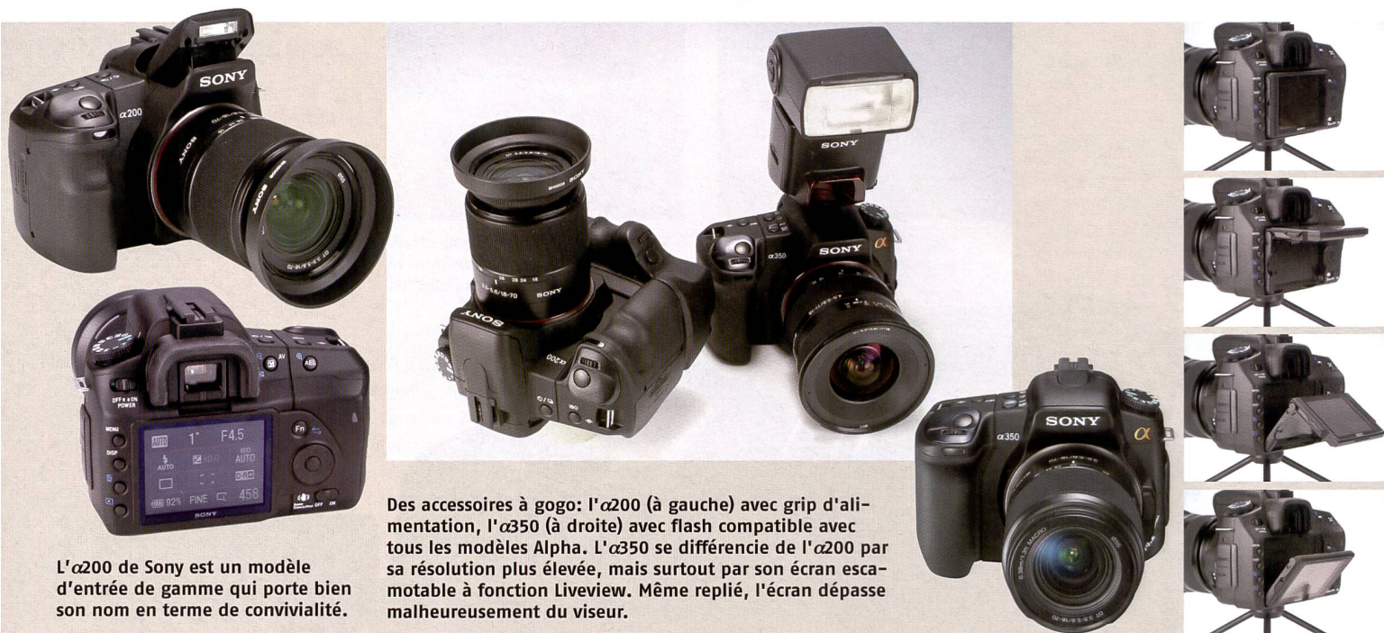
L' \alpha 200 de Sony est un modèle d'entrée de gamme qui porte bien son nom en terme de convivialité.

330 et l'E-3 et Panasonic avec le Lumix L10) à offrir cette possibilité. Combiné à la fonction Liveview, l'écran ouvre des perspectives photographiques intéressantes et un contrôle confortable du cadrage en toute situation. L' \alpha 350 et l' \alpha 300 intègrent uniquement le mode Liveview A, c'est-à-dire la prise en charge de la prévisualisation par un petit capteur situé dans le viseur. Avantage: pas be-