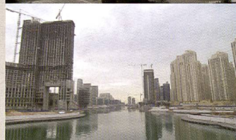
Dubaï: une architecture ultra moderne et 6000 chantiers façonnent l'image de la ville, du spectaculaire «Burj al Arab» au gratte-ciel anonyme.