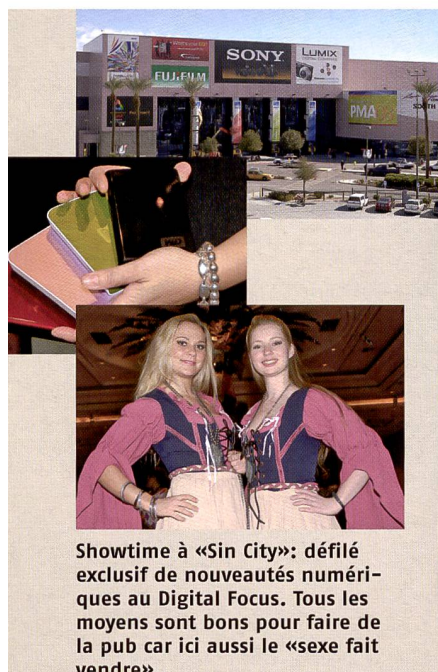
Showtime à «Sin City»: défilé exclusif de nouveautés numériques au Digital Focus. Tous les moyens sont bons pour faire de la pub car ici aussi le «sexe fait vendre».

La PMA est l'occasion de présenter de nouveaux appareils photo en bénéficiant d'une attention accrue. Dans ce contexte, il est intéressant de noter que General Electric (oui, le fabricant de lave-linge, sèche-cheveux et locomotives diesel) envisage dorénavant de commercialiser ses appareils numériques sur le