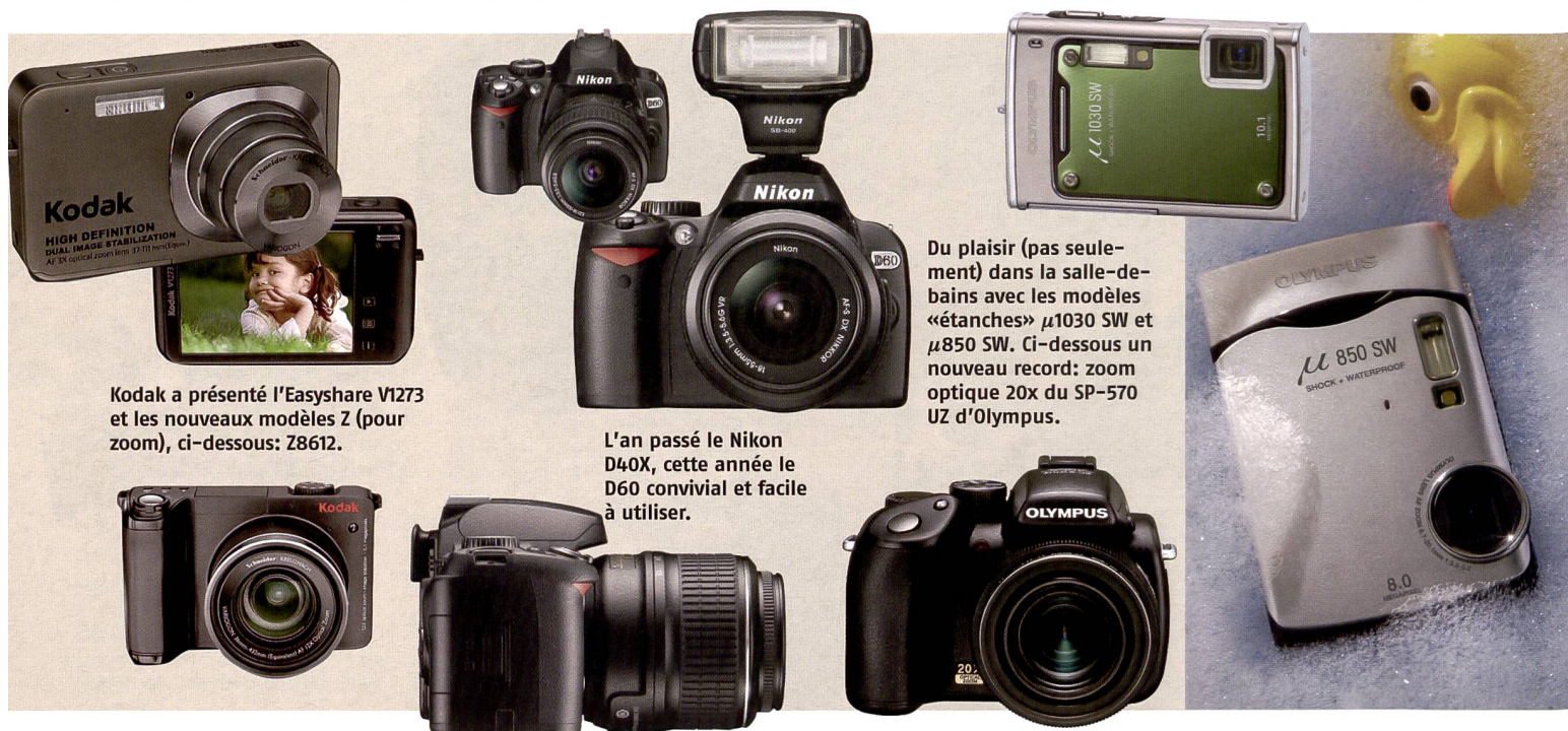
Kodak a présenté l'EasysShare V1273 et les nouveaux modèles Z (pour zoom), ci-dessous: Z8612.

Dans la catégorie des appareils à superzoom également, le cons-