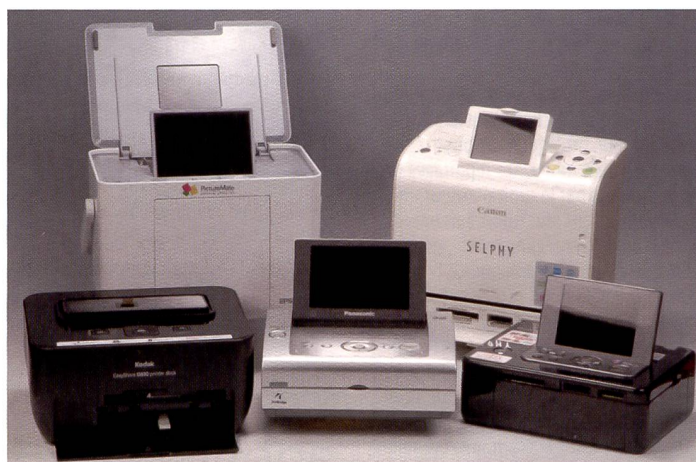
Les meilleures imprimantes du moment. Nous avons testé (de g à d) l'Easyshare G610 de Kodak, la Picturemate PM 260 d'Epson, la PX20 de Panasonic, la Selphy ES2 de Canon et la FP90 de Sony. Non contentes d'être jolies à regarder – ce qui en fait toujours un cadeau très prisé –, elles se distinguent aussi par des performances intéressantes.

Ne vous y trompez pas! La compacité de ces imprimantes ne rime pas avec performances modestes. Nous avons sélectionné les modèles les plus performants de différents fabricants qui impriment le format 10 x 15 cm et avons testé leurs caractéristiques dans la pratique.