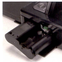
Le magasin à film de l'imprimante Sony. Les cartes mémoire se chargent par le devant.