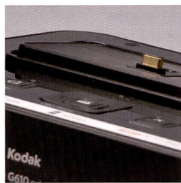
Les appareils photo Easyshare s'enfichent directement sur l'imprimante Kodak.