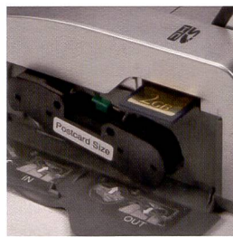
Transparents et carte-mémoire sont introduits sous le cache latéral de l'imprimante Panasonic.