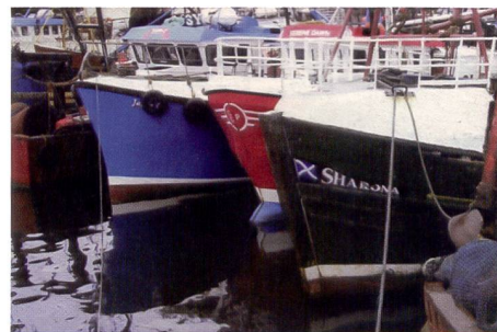
Certains détails passent à la trappe sur la photo imprimée avec le modèle Sony, mais le résultat est très correct par ailleurs.

prend en charge le plus grand nombre de cartes mémoire. L'imprimante Sony n'accepte pas les cartes xD, le modèle Panasonic PX20 refuse les cartes CF également.