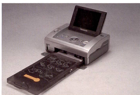
L'imprimante Panasonic PX20 est la plus petite du lot et dispose néanmoins d'un écran offrant une diagonale de 9,1 cm.