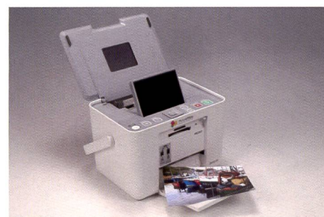
L'Epson Picturemate PM 260 au «design cubique» fait confiance à la technologie jet d'encre et bat ainsi le record de vitesse.