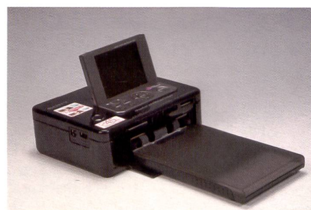
Simple, belle et rapide: le modèle Sony ne met que 45 secondes pour imprimer la photo.