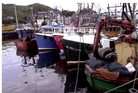
Image originale directement issue de l'appareil et sans passage par l'imprimant et le scanner en guise de référence pour évaluer les photos.

La palme de l'agacement revient à la Kodak G610 car l'utilisateur recherche en vain une fente pour