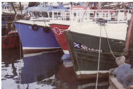
La photo faite avec le modèle Panasonic révèle des couleurs plutôt plates, les contrastes laissent plutôt à désirer.