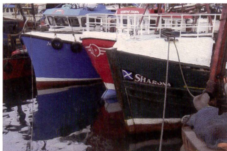
Le tirage de la Kodak G610 affiche de très bonnes valeurs colorimétriques. La plage de contraste est bien restituée elle aussi.