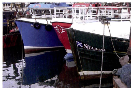
Un extrait à 100% de la photo. Il a été choisi de manière à pouvoir évaluer les couleurs et la dynamique.