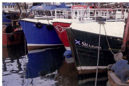
La photo numérisée par l'imprimante Canon révèle des couleurs très vives qui sont plus chaudes que sur la photo originale.