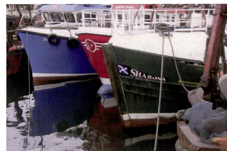
La Picturemate fait mouche dans les parties sombres; aucune autre imprimante testée n'a pu mieux faire en termes de piqué des ombres.

selon le même principe. La Panasonic PX20 est la seule imprimante sur laquelle cette cartouche coince légèrement de sorte qu'il faut malgré tout regarder les illustrations de la notice.