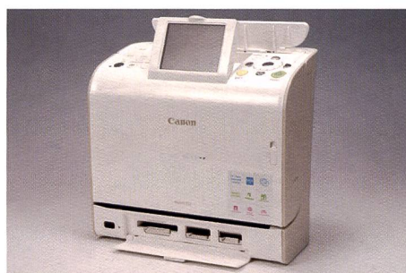
Encombrement réduit pour la Canon Selphy ES2: elle «pousse en hauteur» et se distingue par son design blanc discret et sa connectivité.