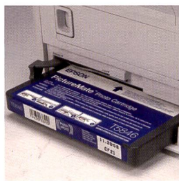
L'Epson Picturemate est la seule imprimante à jet d'encre du test. Elle fonctionne avec une cartouche.