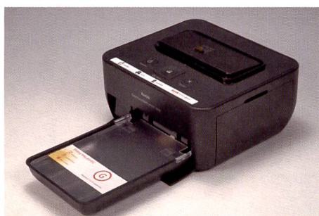
Le modèle peu coûteux Kodak G610 révèle ses atouts en combinaison avec un appareil photo Kodak et dans l'échange simplifié des données.

La photo provenant de la Panasonic PX20 semble dater de plusieurs années parce qu'elle pa-