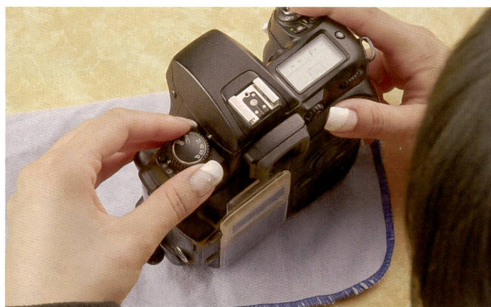
En fonction du modèle d'appareil, il est possible de sélectionner la fonction Nettoyage du capteur dans le menu ou à l'aide d'un sélecteur externe. Le miroir doit être relevé en appuyant légèrement sur le déclencheur, et l'obturateur ouvert, sans que le capteur soit activé.