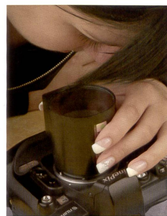
Le contrôle à l'aide d'une loupe révèle si le capteur est maculé ou non. Un capteur propre n'a pas besoin d'être nettoyé.

intéressantes, sont inutilisables. A un moment quelconque, un grain de sable du désert californien s'est égaré dans les entrailles de mon reflex et, obéissant à une logique quasi incompréhensible, a rayé différentes prises, réparties sur plusieurs pellicules.