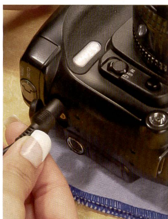
Le mieux est de brancher l'appareil sur le secteur. Sinon, l'obturateur pourrait se refermer au beau milieu de l'intervention.

quoi il n'est pas inutile de se préparer à l'idée d'avoir à nettoyer soi-même son capteur en dernier recours. Nous tenons ici à insister sur le fait que ni le constructeur de l'appareil, ni la rédaction de Fotointern ne peuvent assumer la responsabilité des dommages que pourrait subir le capteur si vous le nettoyez vous-même. Nous vous conseillons