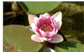
Bracketing de la saturation des couleurs par incrément de +/- 3. Ici, bracketing à + 1 IL