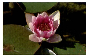
Bracketing de l'exposition: trois mises au point automatiques à +/- 1 IL