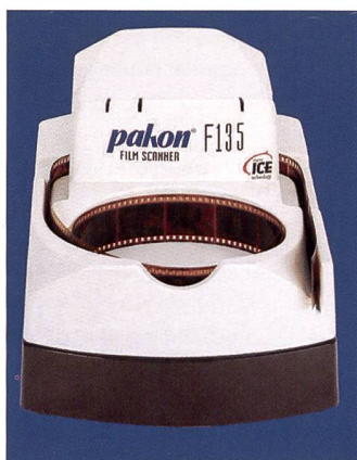
Scanner de films Pakon F135plus

Il y a un an, Tribex Trading SA a repris la représentation en Suisse du fabricant al-