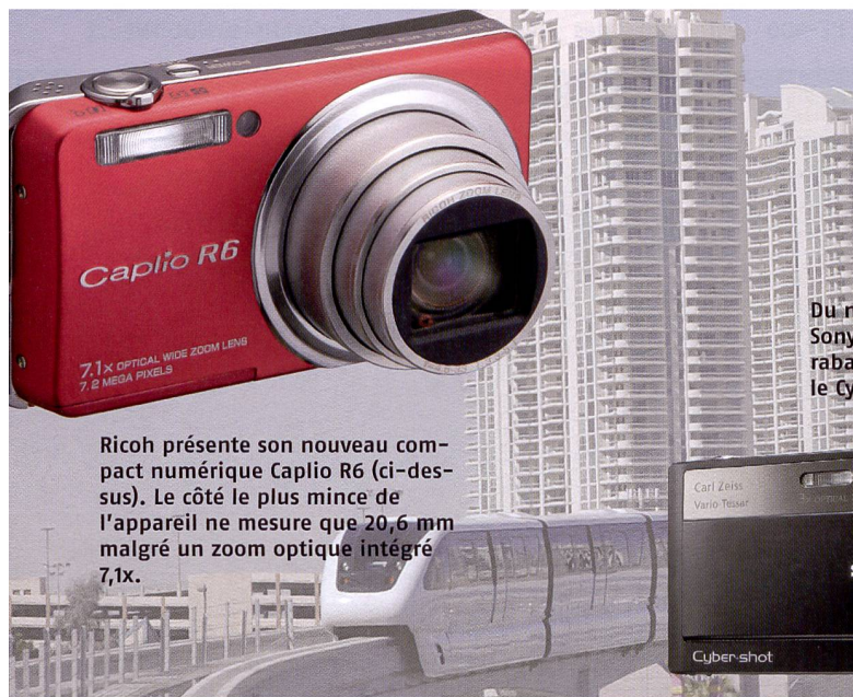
Ricoh présente son nouveau compact numérique Caplio R6 (ci-dessus). Le côté le plus mince de l'appareil ne mesure que 20,6 mm malgré un zoom optique intégré 7,1x.

plein format qu'avec les capteurs APS-C des reflex numériques, ce télézoom s'inscrit dans le concept éprouvé du Tamron f2,8/28-75mm en complétant la gamme télé jusqu'à 200 mm. Une distance minimale de mise au point de 0,95 m seulement sur toute la plage focale, un rapport de grossissement de 1:3,1 et un système de mise au point interne très performant caractérisent ce nouveau venu. La plage télé moyenne de 70mm à 200mm est pleinement exploitée sur les appareils dotés de capteur plein format, tandis