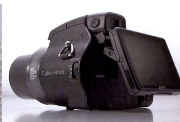
Du nouveau dans la série Cyber-shot H de Sony: en haut le modèle H9 avec écran rabattable et pivotant et zoom 15x. En bas: le Cyber-shot T20.