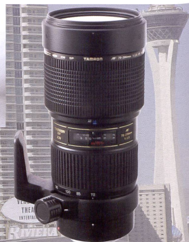
Le prototype de Tamron: développement de l'objectif SP AF f2,8/70-200mm F/Di (IF) Macro.

Deux éléments SLD et trois lentilles asphériques corrigent les distorsions optiques courantes. Le traitement SML empêchent les réflexions et aberrations chromatiques tout en équilibrant les couleurs. Le télézoom 100-300 DG est désormais disponible avec monture Sony et Pentax.