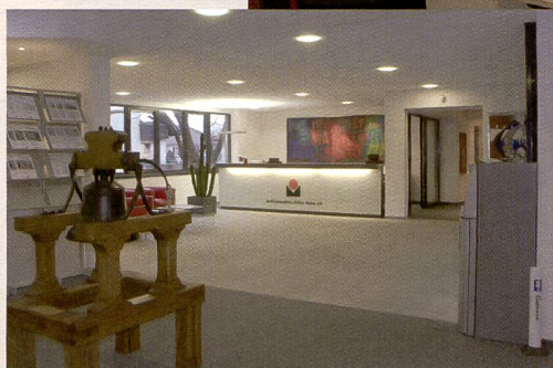
Le bureau d'architecte Oskar Meier AG ( www.omag.ch ) de Büllach utilise sa Canon iPF 700 pour imprimer des plans grand format et des visuels.