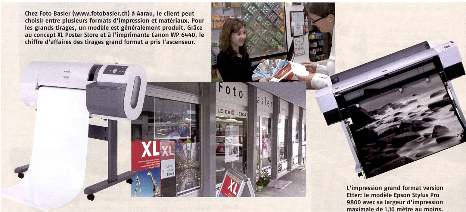
L'impression grand format version Etter: le modèle Epson Stylus Pro 9800 avec sa largeur d'impression maximale de 1,10 mètre au moins.

Chez Foto Basler ( www.fotobasler.ch ) à Aarau, le client peut choisir entre plusieurs formats d'impression et matériaux. Pour les grands tirages, un modèle est généralement produit. Grâce au concept XL Poster Store et à l'imprimante Canon WP 6440, le chiffre d'affaires des tirages grand format a pris l'ascenseur.