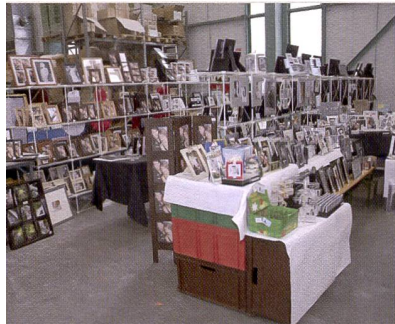
La table avec les échantillons (e. ht) et la vue sur les entrepôts (en bas).

n'importe quelle photo de famille, portrait ou photo d'enfant. Car une chose est sûre: en général, on a trop tendance à négliger la présentation des photos. Mais c'est sur ce segment que le commerçant photo entreprenant, que le photographe innovant peut se démarquer de la concurrence - une nécessité dans ce siècle du numérique omniprésent. Les albums et cartes de la série Positiv