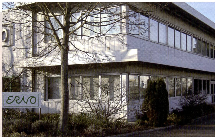
Le nom Erno est synonyme depuis 1947 de service et de qualité.