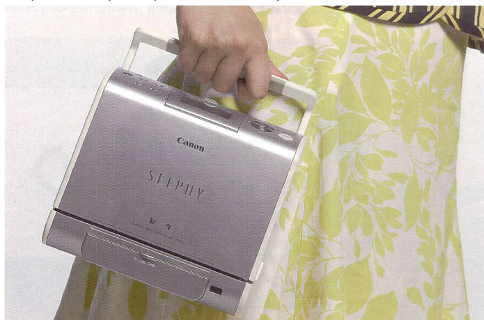
La Selphy ES1 de Canon se distingue par une nouvelle cassette contenant les couleurs et le papier, ce qui la rend très facile à utiliser. Une seule cassette permet de réaliser jusqu'à 50 clichés. La Selphy ES1 est en vente dès à présent au prix de 358 CHF.

Nous avons déjà présenté dans Fotointern plusieurs vues d'ensemble du marché actuel des petites imprimantes photo. Nous avons décidé cette fois-ci de nous pencher sur la dernière née de la famille Canon présentée à la Photokina '06, la Selphy ES1, et avons imprimé quelques cartes postales.