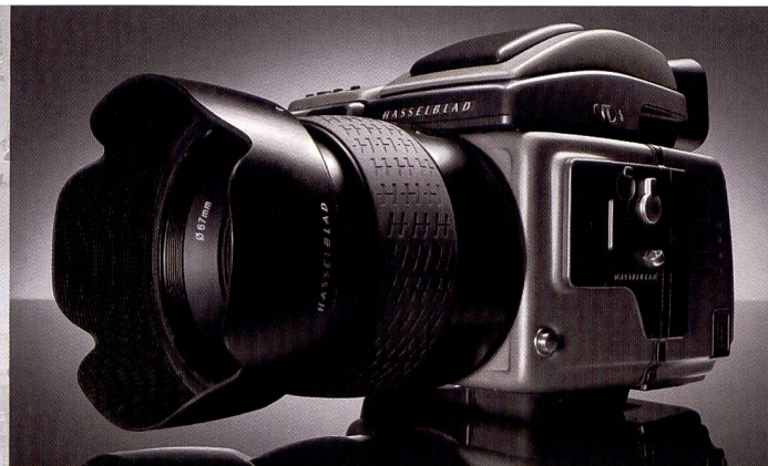
Hasselblad H3D: reflex numérique plein format 48-mm.