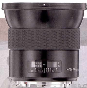
Le Hasselblad H3D dispose d'un «vrai» grand angulaire de 28 mm.