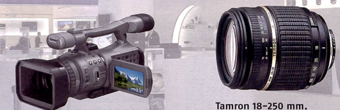
Sony HDR-FX7: nouveau caméscope HD.