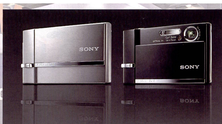
Sony Cybershot: dernier né des «ultra plats» avec stabilisation d'image.

CCD 10 mégapixels. Les prises de vue sont sauvegardées une première fois sans perte de résolution sur la carte mémoire et une seconde fois sous forme comprimée dans une mémoire tampon intégrée à partir de laquelle l'utilisateur peut créer un «album photo interne». Ces deux modèles sont équipés d'un écran ACL 3 pouces et proposent une fonction d'édition complète de diaporamas avec création d'enchaînements, de fonds musicaux et de commentaires audio.