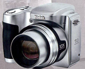
Easy Share Z710: zomm 10x et commande intuitive.