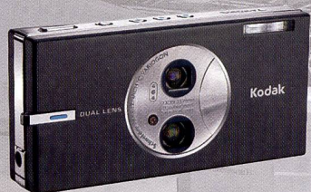
Easy Share V705: lentille double et technologie «Anti-Blur».

Doté d'un capteur 28 mégapixels, le Leaf Aptus 655 atteint une vitesse de 0,95 seconde par image, soit 62 vues par minute. Le Leaf Aptus 54S accélère à 75 images par minute pour une résolution de 22 mégapixels.