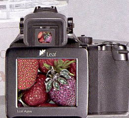
Leaf Aptus 75.

l'image. Grâce à l'association d'un capteur d'image de dimensions 36 x 48 mm et du nouvel objectif 28 mm, le photographe retrouve la joie des «véritables» prises de vue grand angle en moyen format. Les deux nouveaux scanners photo haut de gamme Flextight X1 et Flextight X5 ont été mis au point pour les photographes professionnels et les ateliers de photographie à la recherche d'une qualité d'image irréprochable et d'une vitesse de numérisation élevée. Ces nouveaux modèles sont équipés chacun d'un capteur optique CCD 3 x 8000 et d'un objectif Rodenstock. Ils viennent remplacer la série Flextight de Hasselblad et possèdent une nouvelle fonction ultra rapide «Auto Scan».