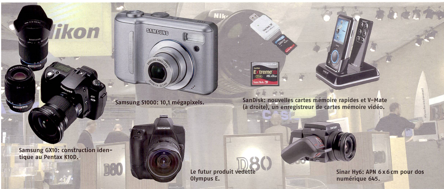
Samsung S1000: 10,1 mégapixels.

Durant l'exercice 2005/06 clôturé fin mars, l'enseigne de tradition Leica a augmenté son chiffre d'affaires de 16 % pour atteindre 107 mio. d'euros et diviser par deux sa perte qui passe à 9,2 millions d'euro. L'actionnaire français Hermes a récemment cédé sa participation au groupe autrichien ACM qui détient désormais 88 % de Leica.