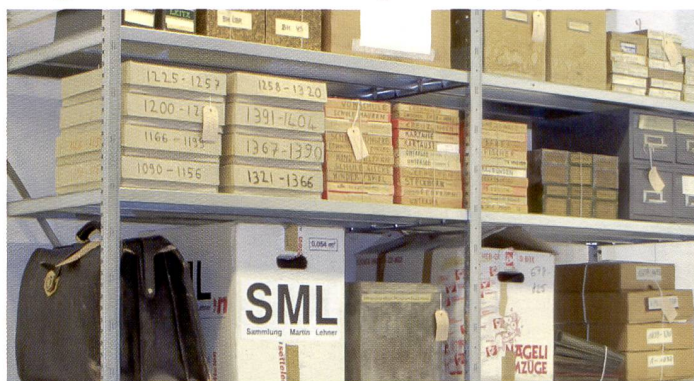
«Fotostiftung Schweiz» veut conserver des archives importantes pour la postérité. Mais la numérisation ne va pas sans soulever des problèmes.

Un groupe d'expert réuni récemment à Winterthour s'est demandé quelles photos nous devons léguer à la postérité. Ce qui est sûr, c'est que les tirages, les négatifs et les diapos correctement conservés sont toujours à privilégier aux données image numériques.