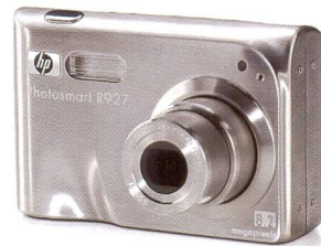
HP PHOTOSMART R 927

LA SEULE CHOSE QUI REND NOS IMPRIMANTES PLUS PERFOR- MANTES: NOS DIGICAMS