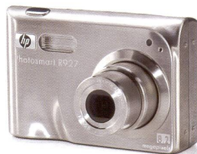
HP PHOTOSMART R 927

www.hp.com/ch/photographienumerique HP – the leading printing company