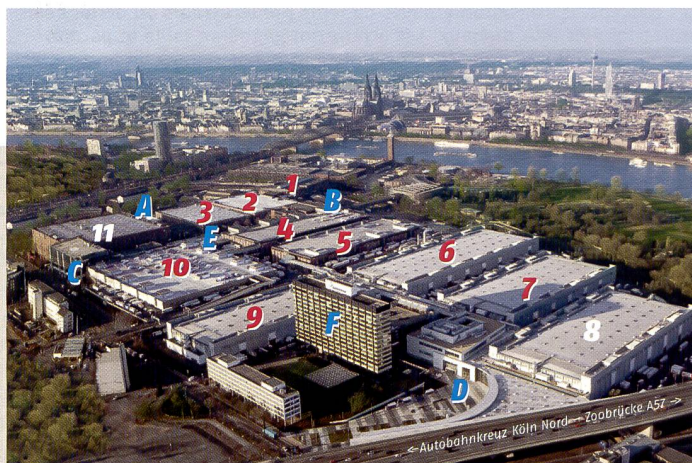
Hall 1: Visual Gallery, programme d'accompagnement; halls 2, 3, 4.2, 5, 6: prise de vues/équipement; hall 4.1: retouche des images; hall 6: sauvegarde; hall 7: accessoires, consommables; hall 9: présentation; halls 4.1, 10: édition des images, services; halls 8, 11: non utilisés.