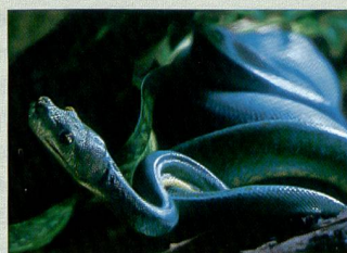
Le Suisse Ivan Baranowski s'est distingué avec cette photo dans la catégorie Wildlife.

Digital Photo Composing: Evaldas Ivanauskas, Lituanie, Night Life: Gerald Förster, Allemagne, Sport: Niels Hougaard, Danemark, Wildlife: Andris Egilits, Lettonie.