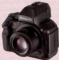
Le Mamiya ZD.

Mamiya a annoncé le transfert dans une nouvelle société de «Optical Equipment Division», fabricant d'appareils moyen format et d'objectifs. Cosmo Digital Imaging Company Ltd. a été fondée pour ce faire par Cosmos Scientific Systems Inc., qui produit des ordinateurs et des accessoires. Cette mesure permettra à Cosmo Digital Imaging de combiner le savoir-faire en matière de logiciels de la société mère avec les compétences photographiques dans la construction d'appareils de Mamiya. L'objectif visé est de consolider la position sur le marché de la photographie