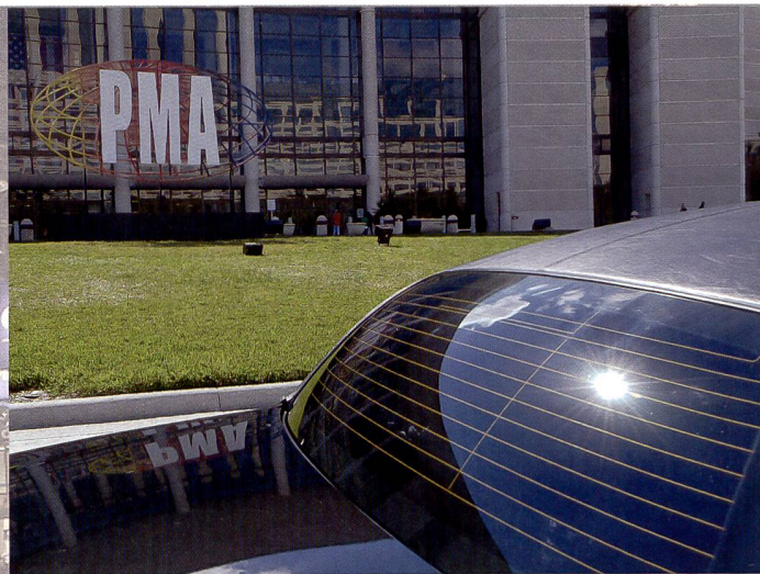
De nouvelles marques font leur apparition dans le monde de l'image, d'autres font cruellement défaut. La PMA à Orlando reflète l'évolution de l'industrie de la photo, notamment la tendance de tous les fabricants à se lancer dans le segment des reflex numériques pour photographes amateurs ambitieux.