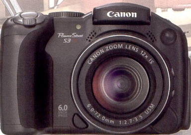
Six mégapixels: Canon Powershot S3 IS.