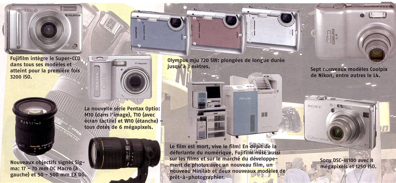
Fujifilm intègre le Super-CCD dans tous ses modèles et atteint pour la première fois 3200 ISO.

Le nouveau SP AF 17-50 mm 2,8 XR Di II LD