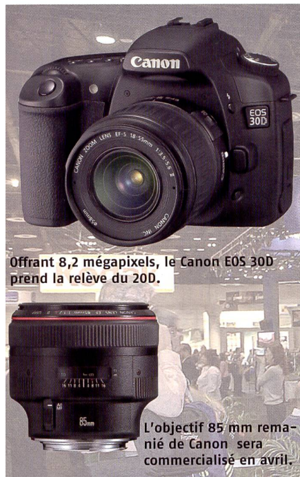
Offrant 8,2 mégapixels, le Canon EOS 30D prend la relève du 20D.

teur d'image pour le système 4/3. Mis au point en collaboration avec Panasonic, il a été présenté lors d'une conférence de presse en combinaison avec le Lumix DMC-L1. Ce nouveau reflex numérique à objectifs interchangeables constitue une tentative de Panasonic de percer sur le marché lucratif des D-SLR. Pour plus de détails, reportez-vous à la page 11. Leica a par ailleurs signalé qu'il faudra attendre l'été pour en savoir plus sur le nouveau boîtier à viseur numérique dont un prototype sera probablement présenté à la Photokina.