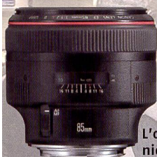
L'objectif 85 mm remanié de Canon sera commercialisé en avril.