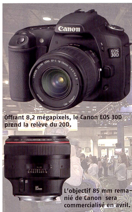
Offrant 8,2 mégapixels, le Canon EOS 30D prend la relève du 20D.

teur d'image pour le système 4/3. Mis au point en collaboration avec Panasonic, il a été présenté lors d'une conférence de presse en combinaison avec le Lumix DMC-L1. Ce nouveau reflex numérique à objectifs interchangeables constitue une tentative de Panasonic de percer sur le marché lucratif des D-SLR. Pour plus de détails, reportez-vous à la page 11. Leica a par ailleurs signalé qu'il faudra attendre l'été pour en savoir plus sur le nouveau boîtier à viseur numérique dont un prototype sera probablement présenté à la Photokina.