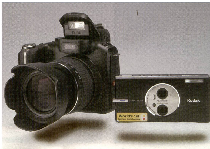
La famille Easy-Share de Kodak s'agrandit avec la sortie de deux nouveaux modèles intéressants: le V570, un boîtier original à double focale, et le P880 alliant fonctionnalités professionnelles, compacité et polyvalence grâce à des accessoires comme les convertisseurs.

Aussi, le passage d'un système optique à l'autre est-il imperceptible – à part un arrêt momentané du zoom et un flou de transition passager. Le grand-angle de 23 mm (équivalent petit format) est au bas mot incroyable dans cette catégorie d'APN, sans compter que le boîtier intègre en prime un zoom 39-117 mm. L'autofocus offre un contrôle multi-zones, la plage de focale ultra grand-angle est fixe de 0,8 m à l'infini. En plus, le V570 se glisse