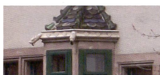
Le V570 «cartonne» dans le grand-angulaire extrême de 23 mm, sans aucun compromis dans les couleurs ni les contrastes.