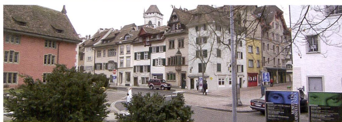
Différence entre le grand-angle «normal» du V570 de Kodak et le grand-angle extrême de 23 mm (équivalent petit format) du second système d'objectif. Un mode panoramique permet d'étendre celui-ci à 180° par assemblage de trois vues.

malheureusement défaut au P880. En contrepartie, ce dernier peut se targuer d'un zoom 6x 24-