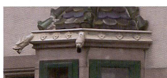
Le P880 de Kodak convainc par sa définition élevée, ses couleurs intenses et très naturelles ainsi que par la fidélité des détails.