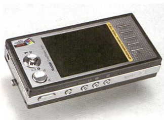
Avec son grand écran et son design épuré: le Kodak V570 est aussi un véritable bijou.

pression Easy-Share toujours sans rivales en termes de facilité d'utilisation, Kodak lance de plus en plus de produits de niche, compatibles avec les applications les plus diverses.