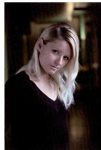
Absence quasi totale de bruit avec l'EOS 5D de Canon à 800 ISO. Couleurs assez soutenues en mode standard.

EOS fidèle à lui-même En concevant l'EOS 5D, Canon a repris point par point le concept de commande de sa ligne EOS. En plus de la molette de réglage près du déclencheur, une seconde molette de sélection de grande taille est positionnée au dos du boîtier pour permettre une bonne accessibilité avec le pouce.