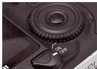
Position assez inconfortable du bouton de mise en marche du 5D.

soit avec le logiciel Digital Photo Professional de Canon soit avec le programme Capture One de Phase One. Enregistrer simultanément les photos au format RAW et JPEG offre l'avantage de disposer instantanément d'images prêtes à l'emploi et de fichiers bruts RAW ouvrant toutes les options de retouche ultérieure.