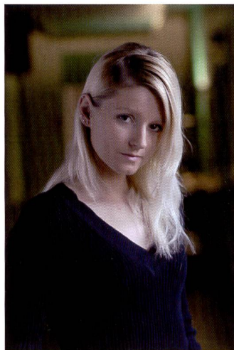
Le portrait réalisé avec le D200 de Nikon ne révèle aucun bruit même à 400 ISO. Tons chair agréables grâce au mode «portrait».

EOS fidèle à lui-même En concevant l'EOS 5D, Canon a repris point par point le concept de commande de sa ligne EOS. En plus de la molette de réglage près du déclencheur, une seconde molette de sélection de grande taille est positionnée au dos du boîtier pour permettre une bonne accessibilité avec le pouce.