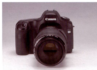
...sur lequel Canon fait visible-ment l'impasse.

pes spécialement pour la photographie de sujets en mouvement. Parmi les autres options, il propose aussi l'AF dynamique et la priorité au sujet le plus proche. Les photographes de sport devraient trouver ces fonctionnalités AF particulièrement à leur goût. Dans le sport, l'essentiel des mouvements se déroulent dans une zone spécifique de l'image et en raison de la vitesse, il est impossible de les capturer avec un seul collimateur.