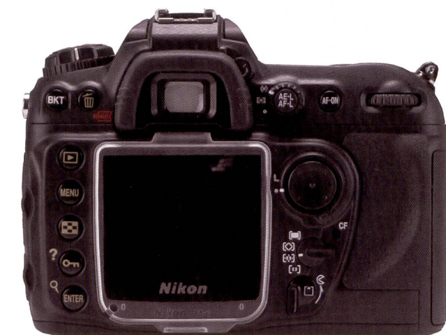
Le grand écran du Nikon D200 est très agréable à regarder.

sionnels à l'occasion; et au chapitre de la séduction, le D200 ne manque vraiment pas d'atouts. Les réglages utilisés fréquemment peuvent être mémorisés de façon à être accessibles à n'importe quel moment en appuyant simplement sur la touche «Func» au-dessous de la touche de mesure de profondeur de champ. Le nombre guide du flash intégré est de 12 seulement, mais grâce à sa compatibilité TTL il permet de piloter un flash externe. De cette façon, les flashes externes assurent l'éclairage principal tandis que le flash intégré illumine uniquement le premier plan.