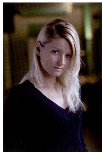
Le portrait réalisé avec le D200 de Nikon ne révèle aucun bruit même à 400 ISO. Tons chair agréables grâce au mode «portrait».

«noir et blanc». Tout comme Nikon pour le D200, Canon reste fidèle pour l'EOS 5D à son concept de positionnement des éléments de commande. Aucune surprise à cet égard, même si le bouton de