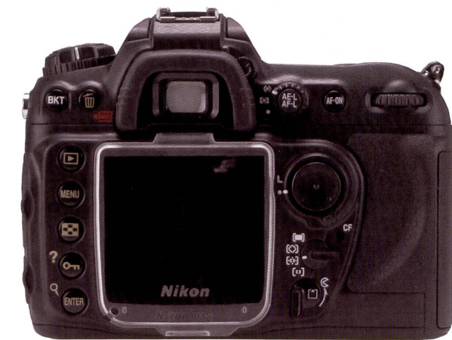
Le grand écran du Nikon D200 est très agréable à regarder.

sionnels à l'occasion; et au chapitre de la séduction, le D200 ne manque vraiment pas d'atouts. Les réglages utilisés fréquemment peuvent être mémorisés de façon à être accessibles à n'importe quel moment en appuyant simplement sur la touche «Func» au-dessous de la touche de mesure de profondeur de champ. Le nombre guide du flash intégré est de 12 seulement, mais grâce à sa compatibilité TTL il permet de piloter un flash externe. De cette façon, les flashes externes assurent l'éclairage principal tandis que le flash intégré illumine uniquement le premier plan.