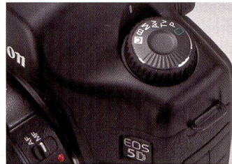
Molette de sélection des modes de prise de vue de l'EOS 5D de Canon.