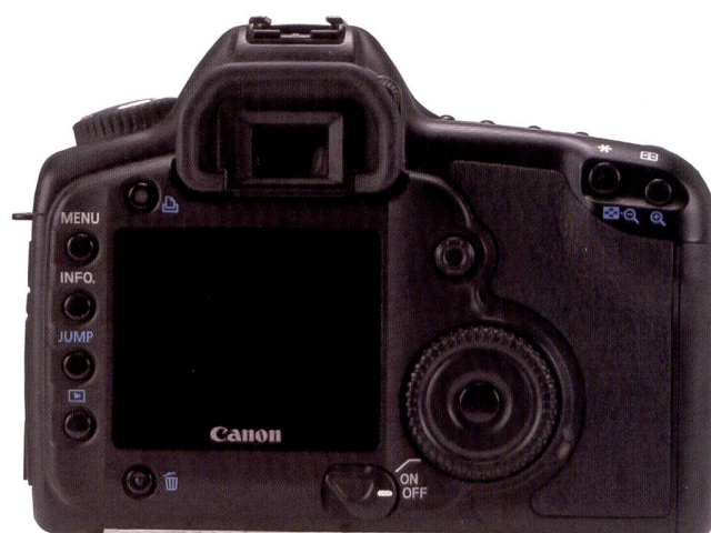
Les éléments de commande avec la molette arrière chez Canon.

Si Nikon poursuit résolument sa politique de développement du capteur CCD au format DX, Canon a