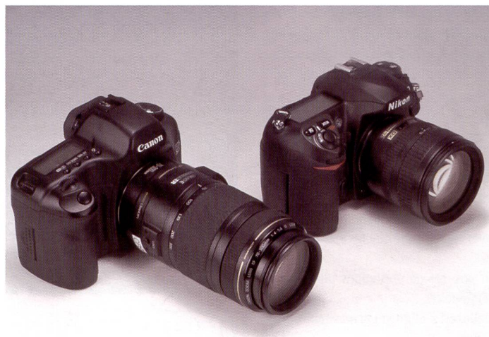
Deux modèles qui devraient séduire à la fois les professionnels et les amateurs ambitieux tout en arrondissant la gamme des deux fabricants: l'EOS 5D de Canon et le D200 de Nikon.

Depuis longtemps, les amateurs appelaient de leurs vœux un appareil d'exception à prix abordable. Canon et Nikon ont enfin exaucé ce souhait en lançant l'EOS 5D et le D200, deux nouveaux reflex numériques qui sauront également séduire les professionnels.