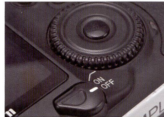
Position assez inconfortable du bouton de mise en marche du 5D.