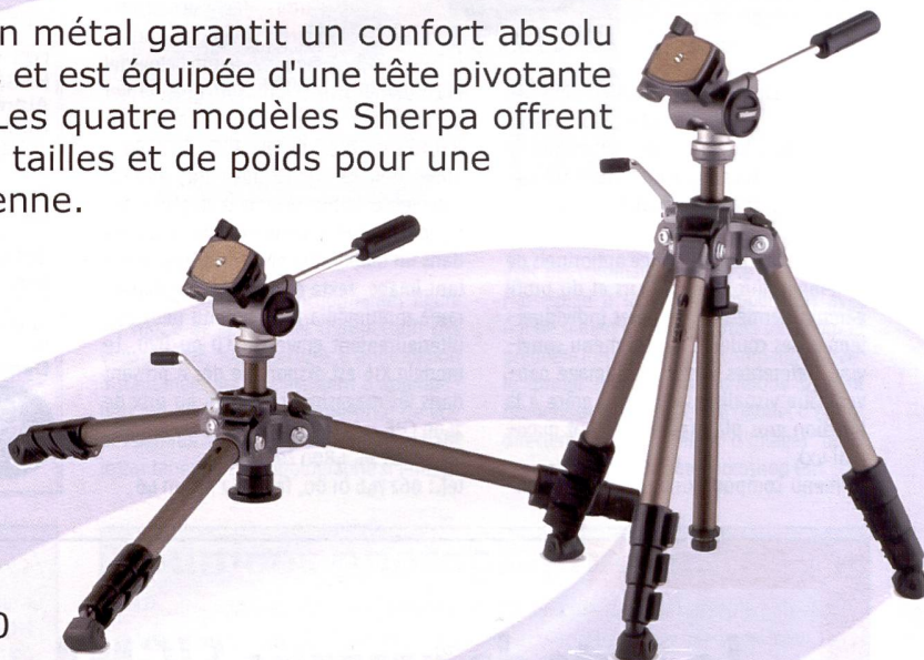
Velbon Sherpa 750

La ligne Sherpa en métal garantit un confort absolu aux professionnels et est équipée d'une tête pivotante sur 3 directions. Les quatre modèles Sherpa offrent un grand choix de tailles et de poids pour une utilisation quotidienne. Dès Fr.139.-