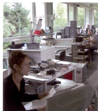
Sept collaborateurs sont affectés à l'administration, au service clientèle et aux réparations.

ailleurs le droit de remplacer un appareil au lieu de le réparer. Les dommages suivants ne sont pas couverts par la garantie Canon: contrôles de routine, c.-à-d. entretien, réparation ou échange de pièces d'usure. Sont également exclus de la garantie les dommages résultant de modifications ou utilisations (sable,