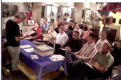
Assemblée des délégués du PpS au Musée Suisse de l'appareil photographique à Vevey

L'association des Photographes professionnels suisses (PpS) a décidé lors de son assemblée des délégués, qui s'est tenue le 4 juin au Musée Suisse de l'appareil photographique de Vevey, de réformer l'actuel apprentissage de photographe. Ce dernier sera remplacé dans les années à venir par un cycle de formation reposant sur une formation préalable aux arts appliqués et sera sanctionné par le brevet professionnel fédéral ou le diplôme fédéral (examen professionnel supérieur).