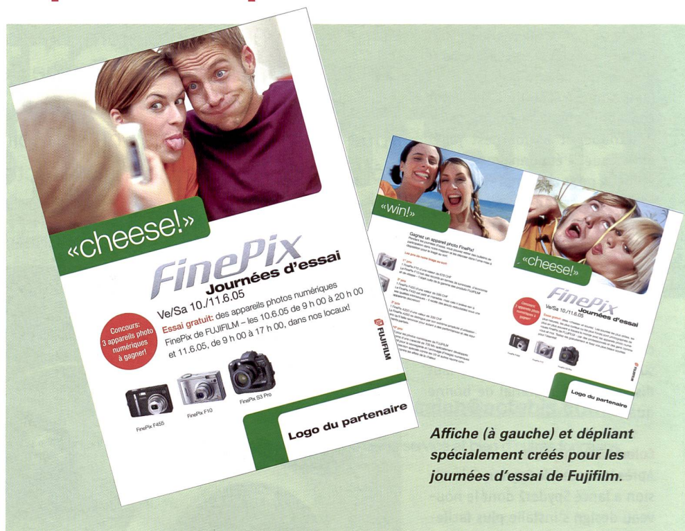
Affiche (à gauche) et dépliant spécialement créés pour les journées d'essai de Fujifilm.

L'expérience prouve que très souvent, les consommateurs achètent avant tout une marque lorsqu'ils choisissent un appareil photo numérique. Le fournisseur, qui a (subjectivement) la meilleure image de marque, a le plus de chances de s'imposer. Quelles possibilités a une marque, dont la qualité est au moins égale à celle des grands labels, mais qui est moins connue en tant que fabricant d'appareils photo? La solution classique avec des campagnes d'image et des publicités sur les produits est très onéreuse, mais demande aussi énormément de temps. Quant à la guerre pure et dure