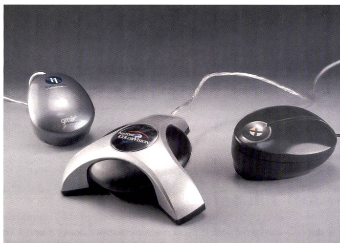
Trois appareils, un objectif: la restitution fidèle des couleurs à l'écran pour l'évaluation des couleurs.

Dans le n°3/05 de Fotointern, nous avons consacré un article à l'étalonnage des écrans, indispensable dans la photo numérique puisque les images ne sont plus contrôlées à la visionneuse mais directement sur écran informatique. Nous vous présentons aujourd'hui trois outils de calibrage.