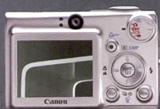
DIGITAL IXUS 700