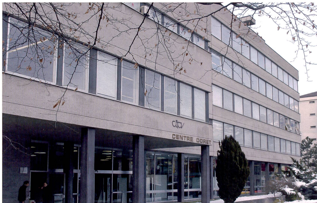
Le CEPV (Centre d'enseignement professionnel de Vevey) est le principal centre de formation aux métiers de la photographie en Romandie. L'école existe depuis près de soixante ans.

teurs en vue de la scène photographique, chargés d'animer de nombreux workshops et conférences, la formation se veut polyvalente. Les diplômés doivent être à l'aise dans tous les domaines de l'image, de la phase conceptuelle à la réalisation. L'enseignement cherche à développer l'approche méthodique, la pensée interdisciplinaire,