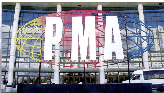
PMA à Orlando - un florilège de nouveautés et de grands espoirs pour l'année 2005 en dépit de la morosité qui touche l'univers numérique.