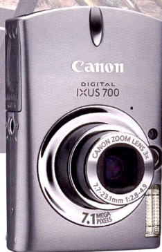
L'élégant Ixus de Canon est proposé avec zoom optique 3x et jusqu'à 7 mégapixels.

deux ans et sont aujourd'hui limités à 4-5 mois, même les gains de résolution ne suffisent plus à stopper la dégringolade des prix. Concord détient le record de prix