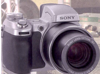
Le Sony DSC-H1 propose un zoom 12x avec 5 mégapixels de résolution.