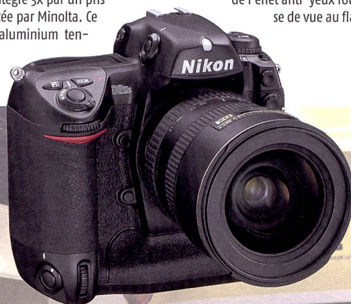
Nikon lance le rapide D2Hs pour la photographie sportive.