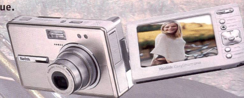
Kodak développe le système «Easy-Share» et lance aussi des appareils plus petits.

n'ont pas manqué au rendez-vous et différentes tendances se sont cristallisées.