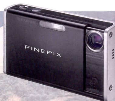
Le FinePix Z1 de Fujifilm avec zoom incorporé.

deux ans et sont aujourd'hui limités à 4-5 mois, même les gains de résolution ne suffisent plus à stopper la dégringolade des prix. Concord détient le record de prix