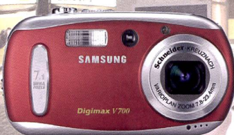
Samsung V700: un design tendance et des couleurs branchées, rouge, bleu, noir et argent.