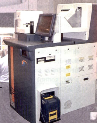
SMI table sur un fort potentiel des minilabs «all-in-one» de la série MK

d'un capteur 7,1 mégapixels et d'un look revisité, assez inhabituel pour un Ixus. Le boîtier gris titane regorge de nouvelles fonctions et abrite un zoom 3x ainsi qu'un écran deux pouces.