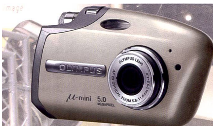
Olympus µ-mini dans trois nouveaux coloris et avec 5 mégapixels.

Il possède un zoom optique 3x qui se rétracte entièrement dans le boîtier - à l'instar des modèles de la série X de Minolta. L'Optio 50 répond aux attentes des novices recherchant un modèle économique avec zoom optique 3x et une résolution de 5 mégapixels. L'Optio 55n marie élégance, finesses techniques et compacité avec une résolution de 5 mégapixels.