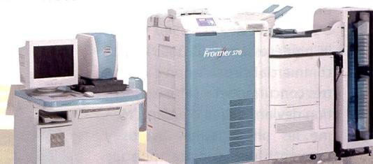
Commercialisés aux Etats-Unis: les minilabs rapides Frontier 550 et 570.