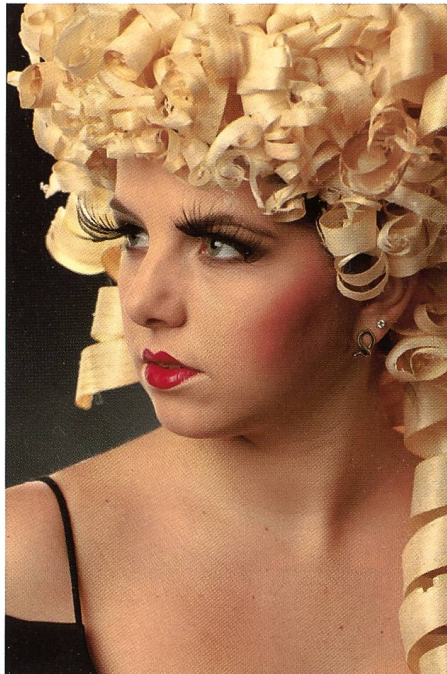
Studioaufnahme mit der EOS 5D Mark III. JPEG direkt aus der Kamera. 1/160 s, Blende 8 bei ISO 125. Dank dem 1:1,4/85 mm Porträtobjektiv knackig scharf.