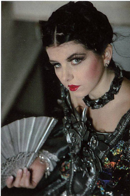
Canon EOS 1Ds Mark III: Available Light Aufnahme, 1/60 s, Blende 4 bei ISO 1600, Brennweite 105 mm. Entwickelt aus RAW-Datei, wobei auch das Rauschen zusätzlich unterdrückt wurde.

in der Regel Mittelformat oder Fachkameras eingesetzt wurden. Die D3X ist mit einem speziell entwickelten CMOS-Bildsensor im FX-Format mit 12-Kanal-Datenausgabe, einem lückenlosen Mikrolinsen-Array und einer in den Bildsensor integrierten Rauschreduzierung ausgestattet. Die Exped-Bildverarbeitung nutzt eine leistungsfähige CPU, die Bilddaten mit 16-bit-Präzision verarbeitet. Die Bilddaten werden mit einer Geschwindigkeit von 35 MB pro Sekunde auf die Speicherkarte geschrieben. Die D3x verfügt über zwei CF-