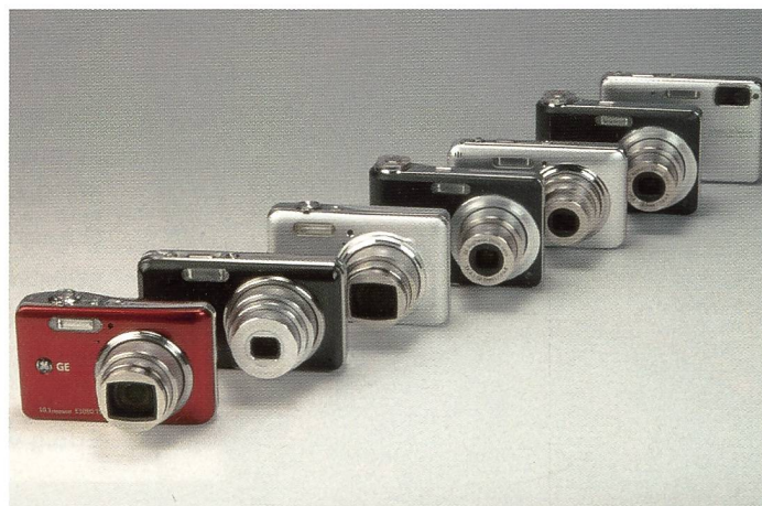
Für jeden was dabei: Die aktuelle Kamerafamilie von General Electric. Jede Kamera ist in mehreren Farben erhältlich. Aufgrund verschiedener Designs lässt sich eine Vielzahl an Vorlieben und möglichen Einsatzgebieten abdecken.