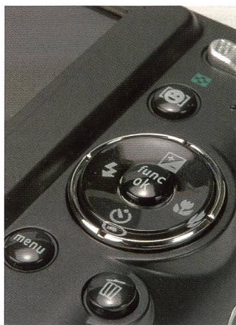
übersichtliches Cockpit: Die Kameras von General Electric erlauben stets einen raschen Zugriff auf alle wichtigen Funktionen.

Mit acht Megapixeln und dem sogenannten 25 mm Body-Styling (was der Dicke der Kamera entspricht) wartet die A835 von