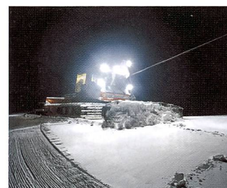
Bilder aus: «Snow Management» von Jules Spinatsch. Copyright beim Fotografen (2008).

Art 08 in Basel und nun in einer Zürcher Galerie wieder einmal dem einheimischen Publikum zugänglich macht. Am geheimnisvollsten und ausserhalb von Fachkreisen nur wenig bekannt ist der Fotograf Jules Spinatsch. Spinatsch verbrachte die Kindheit und Jugendjahre als Sohn einer Hotelierfamilie im Tourismusort. Die Begeisterung für Berge, Schnee und die Atmosphäre des internationalen Tourismus prägten seinen Berufswunsch, als Fotoreporter die Welt zu bereisen. Bis 2000 galt Jules Spinatsch, mittlerweile 36, als talentierter Fotograf, der in seinem Metier mehrfach ausgezeichnet wurde. Er sah sich selbst als Sammler, der aus der Südsee weder Stelen noch geschnitzte Figuren mitbrachte, sondern Bilder.