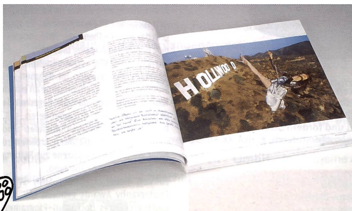
Der klassische Aufbau im Buch von Joe McNally: Auf der einen Seite sein Bild, auf der anderen seine Erläuterungen und Erlebnisse dazu.

Die Seiten in «Der entscheidende Moment» sind verschiedenen Kapiteln zugeordnet («Mit Leidenschaft fotografieren», «Immer in die Kamera schauen», «Die Logik des Lichts», «Irgendetwas reflektiert immer» und viele Tipps) aber eigentlich immer gleich aufgebaut: Auf der einen Seite eine Fotografie von Joe