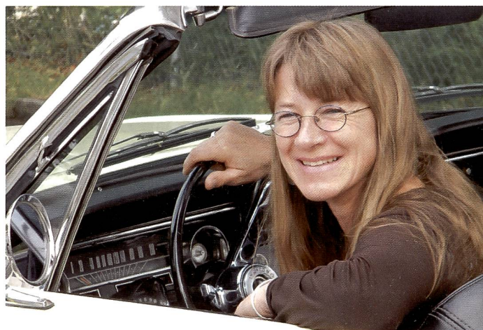
Die Finepix S2000HD liegt gut in der Hand. Die Gesichtserkennung erleichtert Porträtaufnahmen. Bei der Arbeit mit längeren Brennweiten greift – sofern aktiviert – die duale Bildstabilisation mit CCD-Bewegung und automatischer Anpassung von ISO-Werten und Verschlusszeit.

Fujifilm hat mit der S2000HD eine Bridgekamera vorgestellt, die neben Standbildern mit 10 Megapixel Auflösung auch bewegte Sequenzen in HD-Qualität aufnimmt. Sie richtet sich mit ihrem günstigen Preis an Einsteiger, die mehr wünschen, als eine Kompaktkamera.