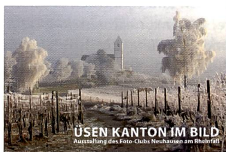
ÜSEN KANTON IM BILD Ausstellung des Foto-Clubs Neuhausen am Rheinfall

Weitere Informationen über den Foto-Club Neuhausen am Rheinfall und dessen Aktivitäten sind unter www.foto-club-neuhausen.ch zu finden.