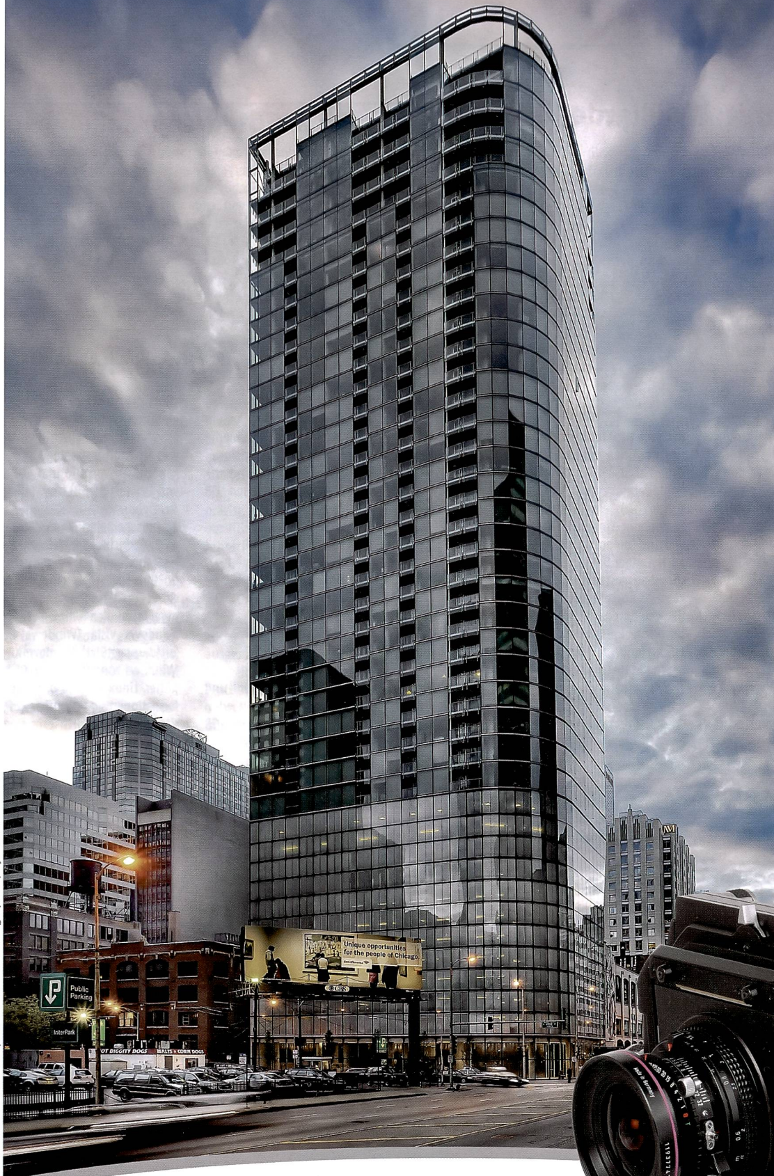
Fairbanks 600, Chicago | Murphy / Jahn Architects