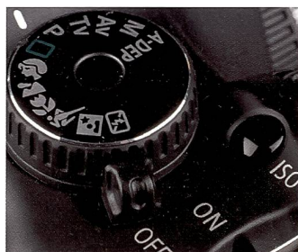
Auf Motivprogramme (hier: EOS 450D) verzichten Profikameras.

Mag sein, dass gestandene Fotografen weniger Wert auf den Live-