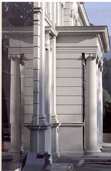
Hier hat der Autofokus richtig reagiert und sich nicht von der Glasscheibe irritieren lassen.

Gewisse Unterschiede zwischen der EOS 40D und der 450D gibt es bei der Bedienung. Die EOS 40D