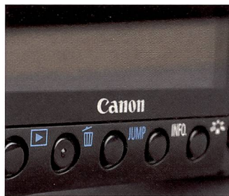
Der grössere Body der 40D bietet mehr Platz für Bedienelemente.

view legen. Die jüngere Generation aber, die quasi mit Kompaktkameras aufgewachsen ist, kann sich das Fotografieren ohne ihn kaum vorstellen. Gute Dienste leistet ei-