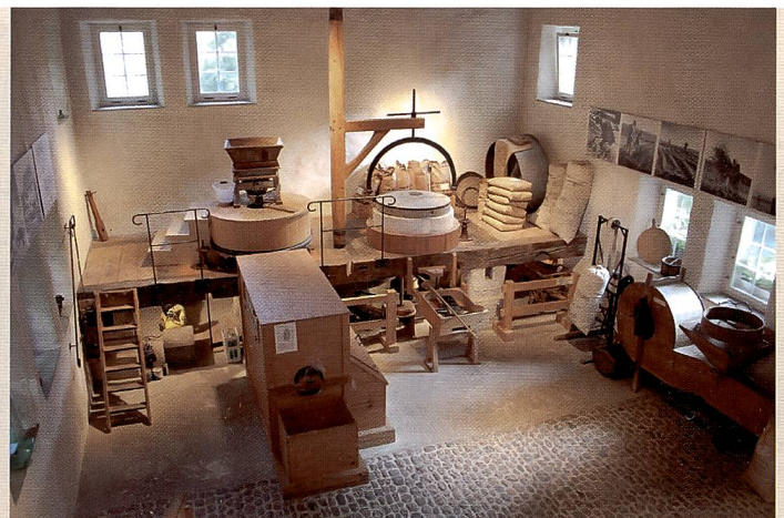
Diese Innenaufnahme (bei ISO 800) meisterte die Canon EOS 450D ohne Probleme.

Ausgewogen: Die EOS 450D belichtet sehr ausgewogen. Unterstützung benötigt die Programmatematik lediglich bei starkem Gegenlicht.