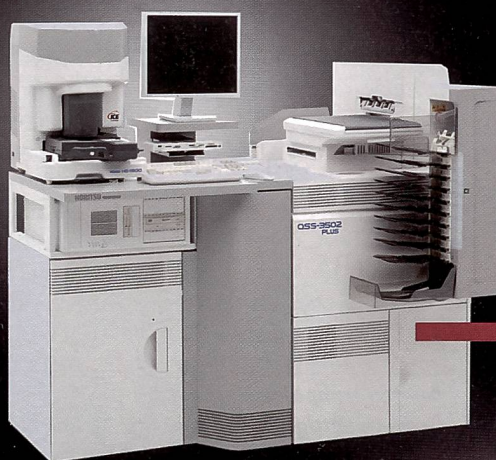
QSS 35 - Series Kompakt- und Bedieneinheit