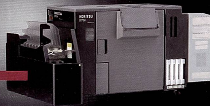
D701 - Neuer Dry Printer mit hoher Leistungsfähigkeit