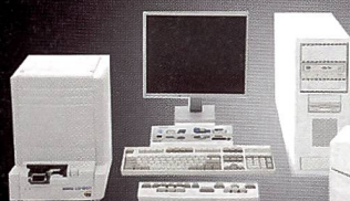
QSS 37 - Series Qualität, Geschwindigkeit und Multifunktionen