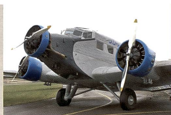
Ein unvergessliches Erlebnis: Rund 800 Gäste von Sony genossen an drei Tagen die vier Ju-52 der Ju-Air im Formationsflug.

Fallschirmspringerausbildung. Nach dem Krieg waren die drei Ju's die «Lastesel der Lüfte» schlechthin, flogen Vampire-Flugzeugteile von England in die Schweiz oder versorgten im Lawinenwinter 1951 abgeschnittene Berggemeinden mit dem Nötigsten. Dann übernahmen immer mehr die Hubschrauber ihre Funktion, welche die Lasten präzise absetzen und nicht nur aus dem Tiefflug abwerfen konnten.