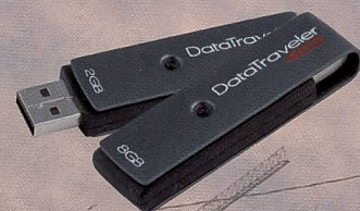
DataTraveller mit Kapazitäten bis zu acht Gigabyte.