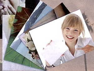
Delkin war mit dem Lumiprint zugegen. Der Leuchtkasten erhellt mit 16 weissen LED's spezielle Inkjet-Folien.