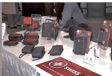
Das Kreuz zieht immer noch an: Die Firma Wenger war mit einer Fototaschen-Kollektion vertreten.

Memory Maker, eine Firma, die in den USA Fotoprodukte wie