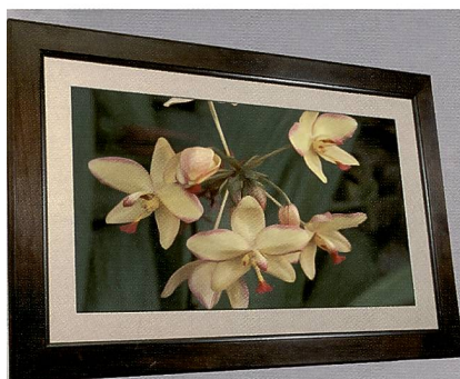
Die wahren Dimensionen können leider hier nicht wiedergegeben werden. Smartparts präsentierte an der PMA in Las Vegas den «weltgrössten» digitalen Bilderrahmen mit einer Bilddiagonale von 32 Zoll.

Das ColorMunki-Portfolio beinhaltet: ColorMunki Photo, eine einfache, schnelle und preiswer-