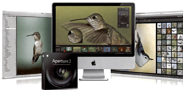
Apples Software Aperture in der Version zwei bedeutet auch rascher Wechsel zwischen verschiedenen Darstellungsoptionen und Verwaltung von grossen Mengen an Bilddateien.

Die Fotosoftware Aperture liegt in einer generalüberholten Version vor. Sie bringt eine Öffnung gegen unten bezüglich der Zielgruppe, Funktionserweiterungen gegen oben, über 100 neue Features und aber vor allem ein Gewinn bei der Geschwindigkeit und einen bei der Bedienbarkeit.