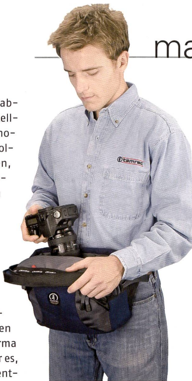
Immer Zugriff auf die Ausrüstung: Velocity von Tamrac

Bei den Velocity Sling Packs handelt es sich um Bodybags mit einem Tragegurt. Die Velocity-Taschen ermöglichen einen schnelleren Zugriff auf die Ausrüstung. Sie können wie ein Rucksack getragen und zum fotografieren einfach vor die Brust gedreht werden und bekommen damit die Funktionalität einer Hüfttasche. Trotz der Drehung der Tasche kann nichts herausfallen, alles ist jederzeit sicher verstaute. Die Deckel öffnen sich vom Körper weg. In den Modellen Velocity 8 und 9 finden sich verstärkte Polsterungen, sowie plastikver-