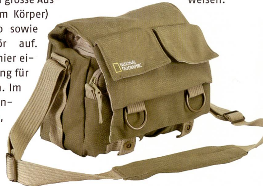
Auf ins Abenteuer! Die Taschen von National Geographic.

Lifestyle vermitteln, wie die Taschen und Rucksäcke mit dem Label «National Geographic» be-weisen.