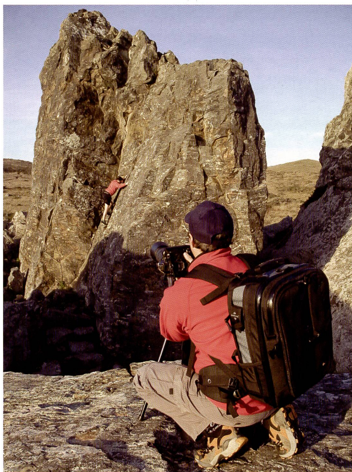
Bestätigen wird es jeder Fotograf oder jede Fotografin: Eine Fototasche, die den eigenen (Foto-)Gewohnheiten entspricht, ist viel wert. Wir haben uns eine Übersicht über das breite Angebot verschafft.

Wer eine Fotoausrüstung sein eigen nennt, braucht auch eine Kameratasche. Weit gefehlt: Wer eine Fotoausrüstung hat, braucht mehrere Kamerataschen, denn diese sollen den Bedürfnissen des Trägers und den Anforderungen des Jobs genügen und die Ausrüstung schützen.