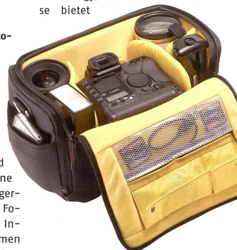
Kameras und Objektive sind in der DC 445 von Kata perfekt isoliert.

Nachdem Kata sich im Videobereich schon länger einen Namen gemacht hat, erschien 2006 mit der Global Digital Collection erstmals auch eine Taschenlinie, die speziell für Fotografen entwickelt wurde. Das Sortiment umfasst neben Rucksäcken, Taschen und Koffern auch praktisches Zubehör wie zum Beispiel die Regenschutzhüllen für viele verschiedene Kameras. Kata nutzt die sogenannte TST (Thermo Shield Technology). Diese bietet