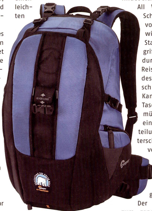
Der Lowepro Primus Rucksack mit 8-Punkte Tragesystem.

heutigen digitalen Videokameras entworfen worden. Das Modell 140 verfügt über ein nach vorne aufklappbares Hauptfach, das einen leichten