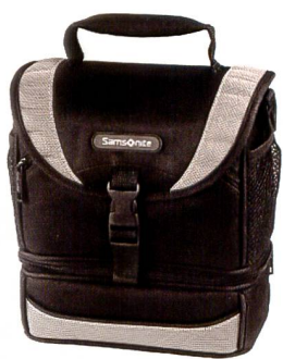
Die strapazierfähige Schultertasche Samsonite Safaga DV 55.

schlussnetzfach und Organizer, sowie ein Dokumentenfach auf der Rückseite und ein Adressfach unter dem Deckel gibt Raum für Reiseunterlagen und Zubehör. Das weiche Fleece-Innenfutter schützt den Inhalt. Weitere Eigenschaften: herausnehmbarer Beutel unter dem Deckel im Hauptfach, neun variable Innen-