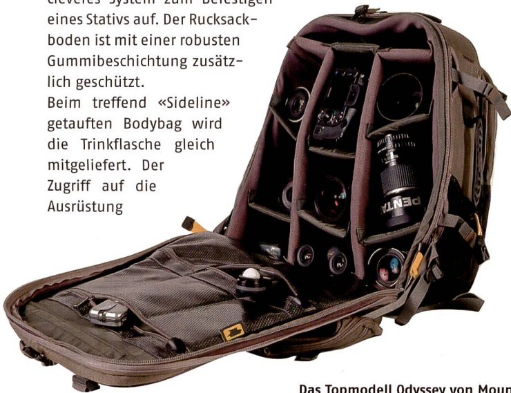
Das Topmodell Odyssey von Moun-tainsmith bietet massig Platz.

Reissverschlussaschen dient zum Verstauen von Zubehör. Auch hier wird eine atmungsaktive Polsterung geboten.