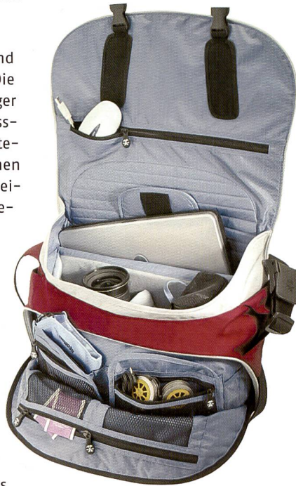
«The Daily»: Die vielseitige Fototasche von Crumpler.

Von «Down Under» kommt die Crumpler Tasche, ursprünglich für Fahrradkuriere konzipiert, hat sie sich