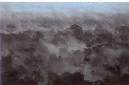
Tropischer Regenwald, Borneo

Die Fondation Beyeler in Riehen zeigt eine eindrückliche Fotografie-Ausstellung.