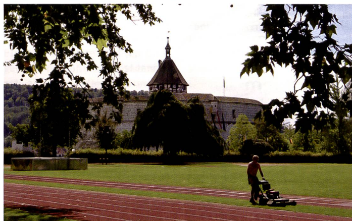
Einsteigern bietet die K100D Super stark automatisierte Aufnahmemodi, die eine Aufnahme praktisch immer gelingen lassen.

erfordert aber öfter auch langes «Scrollen». Häufige Einstellungen (wie ISO-Zahl oder Weissabgleich) können mit der Kombination Funktionstaste plus Wählkreuz schnell angesteuert werden. Die Kamera fühlt sich gut in der Hand an, hat eine angenehme Grösse und die Kunststoffummantelung ist so- lilde.