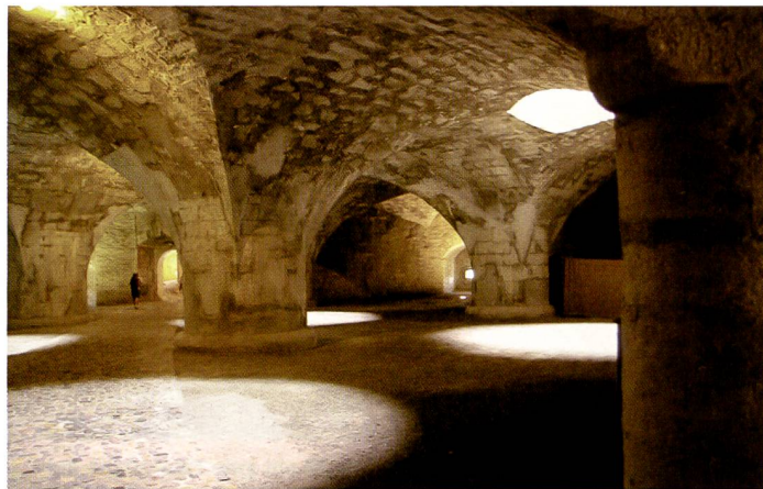
Die K100D Super im «Bauch» des Munots: Neutrale Farben, ein relativ grosser Kontrastumfang und das bei ISO 3'200 und mit AWB.

Seit Ende Juli ist die neue Pentax K100D Super auf dem Markt. Eine neue «Supermacht» auf dem heissbegehrten DSLR-Einsteiger-Markt? Die vorgenommenen Änderungen sind auf jeden Fall gezielt erfolgt und die Stärken der «klassischen» K100D wurden beibehalten. Nachgelegt wurde bei Staubschutz und Kompatibilität zu Objektiven.