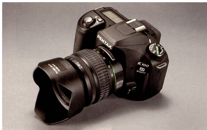
Selten bei einer Kamera in diesem Preissegment ist das zweite Display auf der Oberseite der Spiegelreflexkamera.

Man kann es sich also durchaus einfach machen mit der Kamera und die Pentax als «einfache Knipse» benutzen: Dafür liegen Motivprogramme und zahlreiche automatisierbare Funktionen