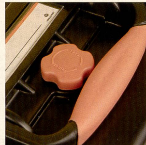
Sicher ist sicher: Koffer im Angebot der Vanguard-Linie.

rere Möglichkeiten, wie die Tasche mitgeführt wird.