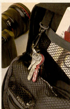
Die Vanguard Oregon Taschen: Der Vorteil steckt im Detail.