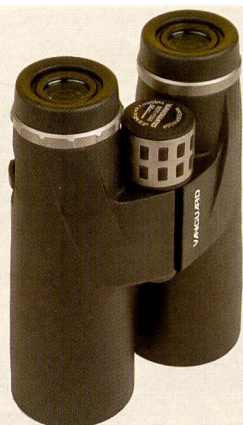
Vanguard bietet auch Optik-Produkte an.

Aussentasche, die aber durch den überlappenden Deckel des Hauptfachs geschützt und nur bei geöffneter Tasche zugänglich ist. Als erwähnenswertes Detail erscheint uns ein kleiner Karabinerhaken, an dem beispielsweise ein Schlüsselbund befestigt werden kann. Wer je in seiner Fototasche nach dem Autoschlüssel gesucht hat, wird