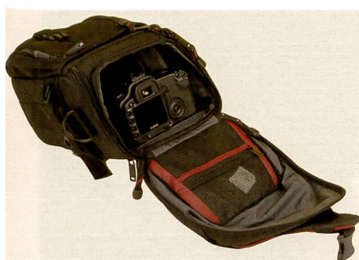
Die Kenline Zoom Taschen sind praktische Begleiter für jeden Fotografen.

Rahmen). Durch die damit geschaffene Möglichkeit der herstellernunabhängigen Vergleichbarkeit der Produkte, dem technischen Kundendienst und dem breiten Know-how bei Anwendungs- und Supportfragen ist Fujifilm für seine Kunden in Handel, Industrie und in der Medizin ein Partner, der eine massgeschneiderte Lösung präsentieren kann. Dank dem grossen Hochregallager in Dielsdorf kann Fujifilm für die ganze Schweiz einen 24-stündigen Liefersdienst aller Materialien gewährleisten. Die Kunden schätzen den 280m 2