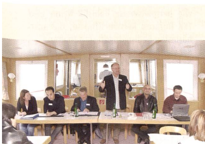
Der Vorstand leitet die GV