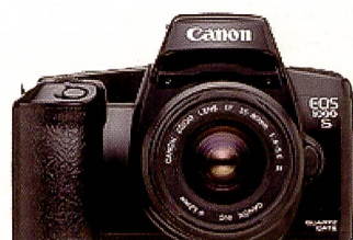
EOS 1000: Mit einem Preis von unter 1'000 DM öffnete die Vorstellung der EOS 1000 die Spiegelreflexfotografie mit dem EOS-System einem größeren Publikum als je zuvor.