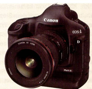
EOS 1D Mark III: Der vorläufige Abschluss und Höhepunkt der EOS-Erfolgsgeschichte. Mit zehn Bildern pro Sekunde bei 10,1 MPix, sowie geringem Rauschen setzt sie neue Standards.