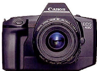
EOS 650: Im März 1987 erblickte die EOS 650 das Licht der Fotowelt. Als erste Kamera war sie mit dem Electro-Focus, kurz EF-Objektivanschluss ausgerüstet und dem Ultraschall-Motor.

Die EOS 650 war also die erste der EOS-Reihe, aber längst nicht die einzige. Zwei Jahre nach der Vorstellung der EOS 650 stellte Canon mit der EOS-1 das erste EOS-Mo-