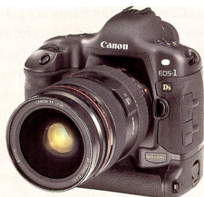
EOS 1DS: Mit einer Grösse von 23,8 mm x 35,8mm hatte der Sensor der 1DS nahezu die identische Masse wie das Kleinbildformat (24 mm x 36 mm), die Auflösung betrug 11,1 MPix.