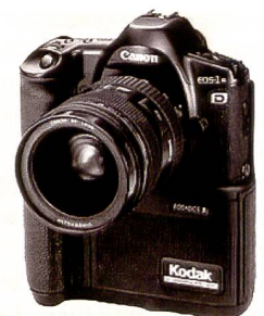
EOS DCS 3: 1995 gab die erste digitale EOS ihr Debüt: Mit einem CCD-Sensor mit 1,3 Megapixeln und einem Preis von 12'000 Euro. An der EOS DCS 3 konnten alle EF-Objektive genutzt werden.