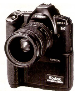
EOS DCS 3: 1995 gab die erste digitale EOS ihr Debüt: Mit einem CCD-Sensor mit 1,3 Megapixeln und einem Preis von 12'000 Euro. An der EOS DCS 3 konnten alle EF-Objektiv genutzt werden.