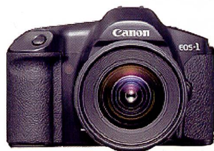
EOS-1: Zwei Jahre danach, das erste EOS-Modell für professionelle Fotografen. Die Serienbildgeschwindigkeit von 5,5 Bildern/s und präziser Autofokus waren wichtige Verkaufsargumente.