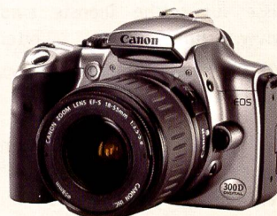
EOS 300 D: Die erste digitale SLR für Konsumenten. Für einen günstigen Preis von unter 1'000 Euro bot die EOS 300D im 2003 fortschrittliche Technologie und eine Auflösung von 6,3 MPix.