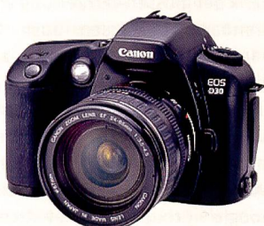
EOS D30: Zeitsprung ins Jahr 2000. In der EOS D30 kam erstmals ein CMOS-Bildsensor zum Einsatz. CMOS wurde zur Kerntechnologie des EOS-Systems, dank geringem Rauschen und grossem Dynamikumfang.

Sortiment Fotografen, sämtliche innovative Technologien zu nutzen und gleichzeitig von ihrer bestehenden Ausrüstung zu profitieren. Diese Kompatibilität er-