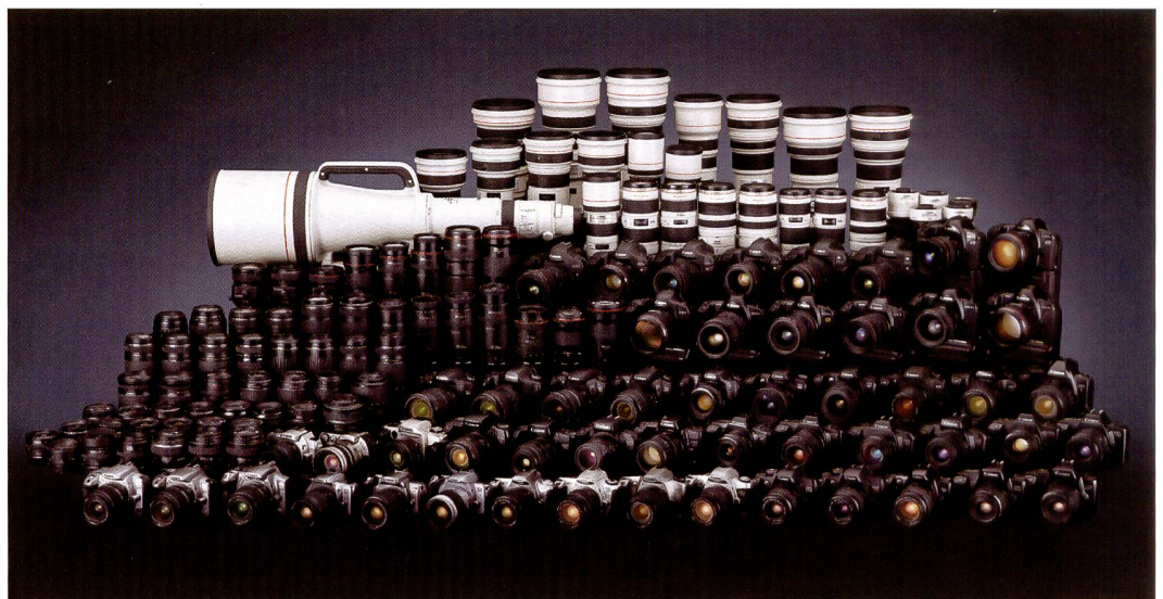
Die ganze Geschichte auf einen Blick: sämtliche Objektiv und Kameras der EOS-Linie von Canon.

Scharfstellung genutzt wird. USM löste zahlreiche Probleme bisheriger Autofokus-Antriebe und gestattete eine schnellere, präzisere und geräuschärmere Fokussierung. Dabei war manuelles Eingreifen des Fotografen in den Autofokus-Prozess jederzeit möglich. Dank ihrer ausgezeichneten Autofokus-Leistung gewannen die EF-Objektive