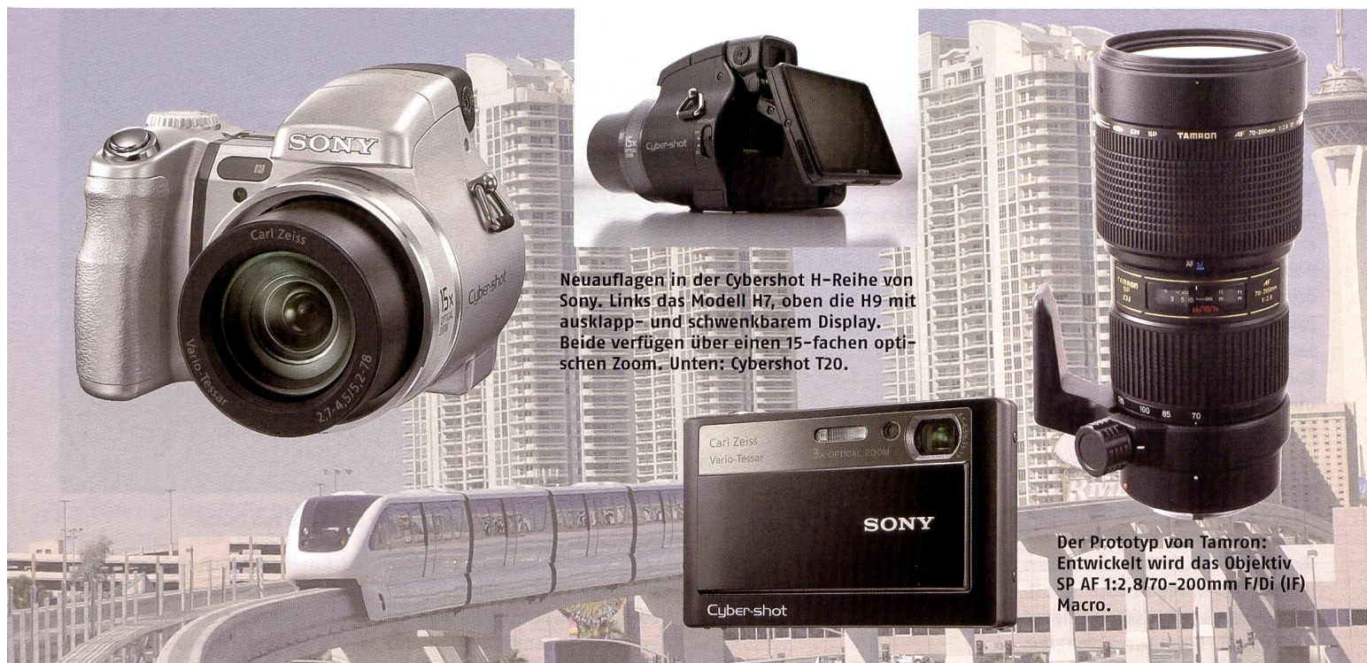
Neuaufgaben in der Cybershot H-Reihe von Sony. Links das Modell H7, oben die H9 mit ausklapp- und schwenkbarem Display. Beide verfügen über einen 15-fachen optischen Zoom. Unten: Cybershot T20.

Konzept des Tamron 1:2,8/28-75mm um den Telebereich bis 200 mm. Eine kurze Naheinstellgrenze von 0,95 m im gesamten Brennweitenbereich, ein Vergrösserungsmassstab von 1:3,1 und ein hocheffizientes internes Fokussiersystem zeichnen das neue Objektiv aus. An Kameras mit Vollformatsensoren wird der mittlere Telebereich von 70mm bis 200mm voll ausgenutzt, während sich für APS-C Sensoren ein rechnerischer Bereich von 109 mm bis 310 mm ergibt (bezogen auf den Bildwinkel des Vollformats). Tamron rechnet mit einem