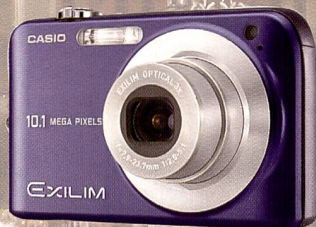
Selbstbewusster Auftritt von Casio: Ihre Neuheiten hat Casio aber bereits vor der Show in Amerika vorgestellt. Links die Exilim Z1050, deren Farbdisplay einen Durchmesser von 6,6 cm aufweist. Rechts die EX-Z75 mit 10,1 Megapixel Auflösung.