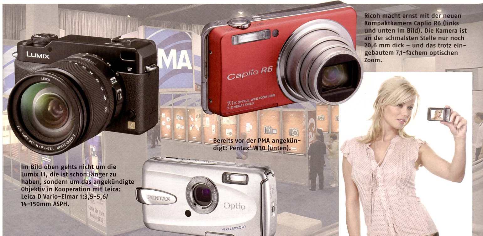
Im Bild oben gehts nicht um die Lumix L1, die ist schon länger zu haben, sondern um das angekündigte Objektiv in Kooperation mit Leica: Leica D Vario-Elmar 1:3,5-5,6/14-150mm ASPH.

Das Universalzoom – speziell für digitale SLR Kameras entwickelt –, verfügt jetzt über eine Stabilisierungstechnologie OS (Optical Stabilizer) von Sigma. Diese Technologie benutzt zwei Sensoren im Inneren des Objektivs, um vertikale und horizontale Bewegungen der Kamera zu erkennen und kompensiert diese durch das Bewegen einer Linsengruppe. Zwei SLD Glaselemente und drei asphärische Linsen korrigieren die bekannten Abbildungsfehler. Die SML Vergütung verhindert Reflexe und Geisterbilder und sorgt für