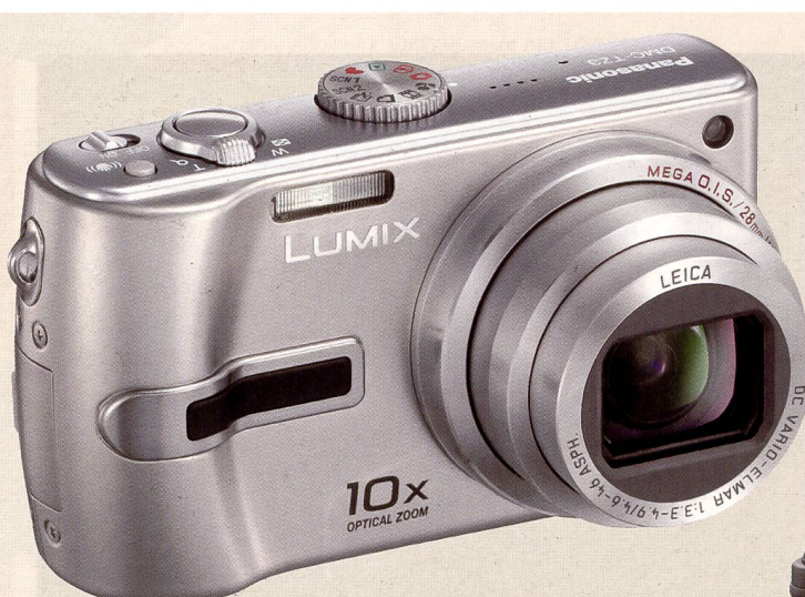
Die neuen kompakten Modelle TZ3/TZ2 und FZ8 von Lumix bestechen vor allem durch ihren grossen optischen Zoomumfang. Die technischen Neuerungen führen dazu, dass ohne Sorge um Verwackelungen mit «freihändig» abgedrückt werden kann. Die Reisekamera TZ3 und ihr Schwestermodell TZ2 gibt's in drei Farben, die Lumix FZ8 in deren zwei, schwarz und silber.