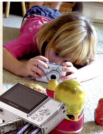
Die grosse Vielfalt: Das Einstiegsmodell LS75 mit Batteriebetrieb (rechts), links unten: FX12. Darunter: Die Lumix FX30 in braun und rechts unten die LZ7 mit sechsfachem optischen Zoom.

Wo wir schon bei den Farben sind: Die Lumix FX30 ist sogar in vier Farben erhältlich (schwarz, silber, blau, braun). Auch das schlanke Gehäuse von nur 2,2 cm Dicke, lässt die Kamera gut aussehen. Auf der technischen Seite lassen sich 7,2 MPix Auflösung und ein 28mm-Weitwinkel-Objektiv mit einer Lichtstärke von f2,8 festhalten. Der 3,6-fache Zoom und ein