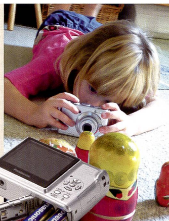
Die grosse Vielfalt: Das Einstiegsmodell LS75 mit Batteriebetrieb (rechts), links unten: FX12. Darunter: Die Lumix FX30 in braun und rechts unten die LZ7 mit sechsfachem optischen Zoom.

Wo wir schon bei den Farben sind: Die Lumix FX30 ist sogar in vier Farben erhältlich (schwarz, silber, blau, braun). Auch das schlanke Gehäuse von nur 2,2 cm Dicke, lässt die Kamera gut aussehen. Auf der technischen Seite lassen sich 7,2 MPix Auflösung und ein 28mm-Weitwinkel-Objektiv mit einer Lichtstärke von f2,8 festhalten. Der 3,6-fache Zoom und ein