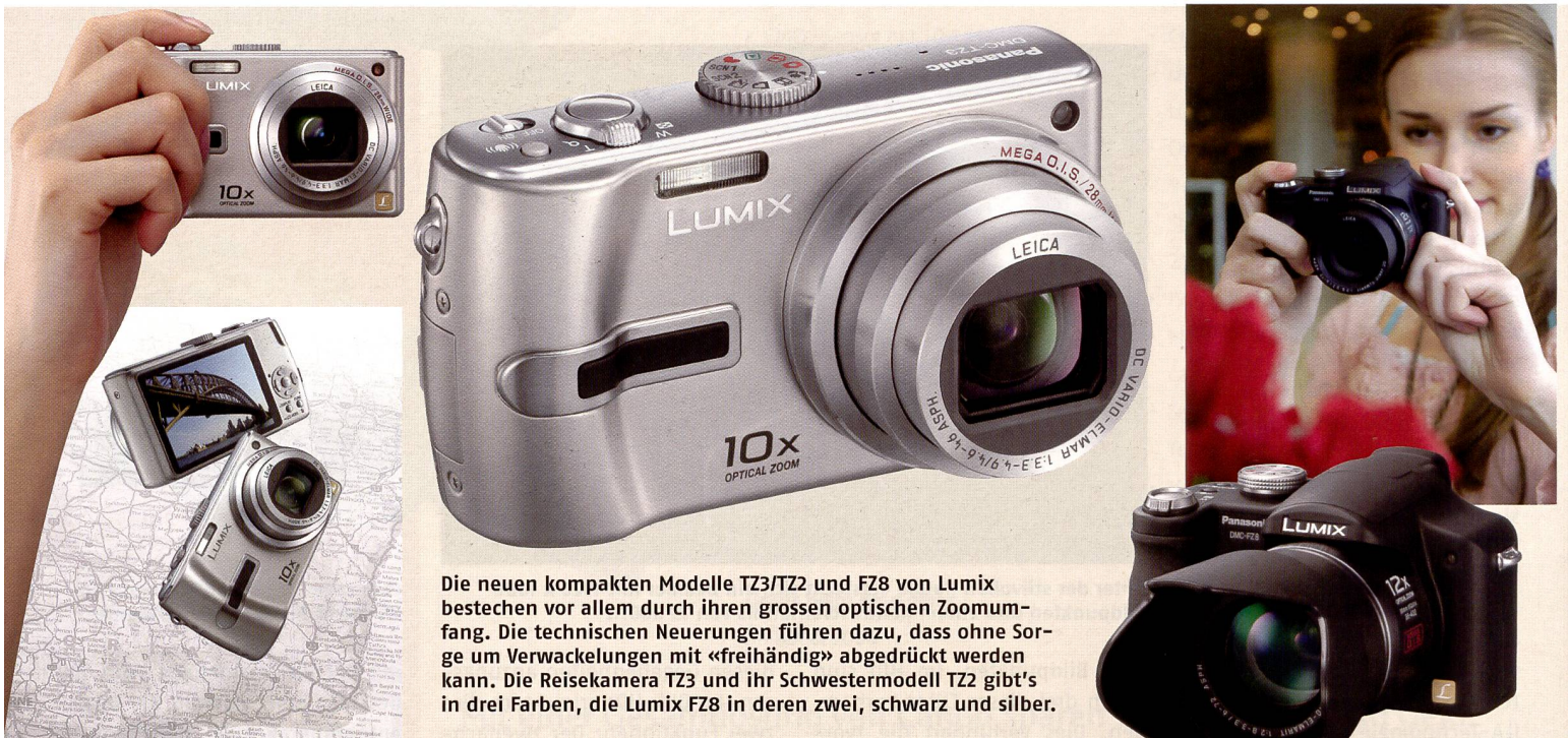
Die neuen kompakten Modelle TZ3/TZ2 und FZ8 von Lumix bestechen vor allem durch ihren grossen optischen Zoomumfang. Die technischen Neuerungen führen dazu, dass ohne Sorge um Verwackelungen mit «freihändig» abgedrückt werden kann. Die Reisekamera TZ3 und ihr Schwestermodell TZ2 gibt's in drei Farben, die Lumix FZ8 in deren zwei, schwarz und silber.

Auch die neue FZ8 vermochte bei den Tests zu überzeugen. Sie ist