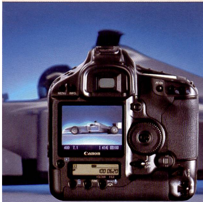
Die EOS-1D Mark III ist das Topmodell für Profi-Fotografen. Neu zum Beispiel das Live-Bild, das neue Autofokus-System und schnellster Dual Digic III-Prozessor.

4096 Farben bei 12-Bit-Bildern. Die CMOS-Sensoren der dritten Generation enthalten einen anderen Pixelaufbau, der zusammen mit der im Chip integrierten Rauschunterdrückungsschaltung für eine hohe Bildqualität bei ISO 3200 sorgt. Die Erweiterung auf H:6400 kann von Fotografen im Nachrichten- und Sportbereich genutzt werden, wenn die Ver-