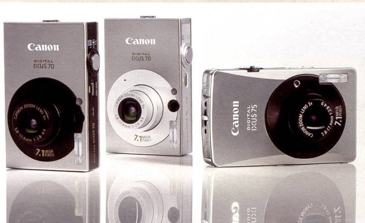
Die Geschichte der Ixus ist bereits zehn Jahre alt. Nun stossen zwei neue Modelle zur Familie: Ixus 75 und Ixus 70 (oben und Mitte unten). In der Mitte oben: Die Canon Powershot A570 IS mit vierfachem Zoom.

Zehnfachzoom. Der neue Camcorder steht dem HV10 zur Seite und beinhaltet Canons 1920x1080 True HD CMOS1-Hochleistungssensor mit 2,96 Megapixeln. Neben der vollen HDAuflösung für die HDV1080i Aufnahme bietet der HV20 als erster HDV1080i Camcorder die Möglichkeit zu progressiven Aufnahmen. Neben dem DVD-Flaggschiff DC50 geht von Canon auch ein DVD Einstiegsmodell an den Start: der DC10. Der Neue bietet einen optischen 35fach-Zoom und DIGIC DV II, Canons Bildprozessor, der