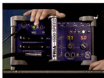
Gerätedemo, zwar herstellerepezifisch, lässt sich aber problemlos auf andere Produkte adaptieren.

dukt – konkret Hensel – für die Demos verwendet wird, so lassen sich die Ideen auch auf andere Blitzsysteme übertragen. Schliesslich bieten alle Hersteller eine Fülle an Lichtformer wie Softboxen, Striplites, Tiefstrahler, Spots usw., die sich oft auch sehr ähnlich sind.