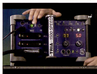
Gerätedemo, zwar herstellerspezifisch, lässt sich aber problemlos auf andere Produkte adaptieren.

dukt – konkret Hensel – für die Demos verwendet wird, so lassen sich die Ideen auch auf andere Blitzsysteme übertragen. Schliesslich bieten alle Hersteller eine Fülle an Lichtformer wie Softboxen, Striplites, Tiefstrahler, Spots usw., die sich oft auch sehr ähnlich sind.