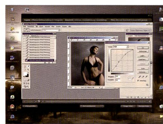
Schritt für Schritt wird die Bildbearbeitung nach dem Fashion Shooting erklärt.

Als letzte DVD möchten wir die von «Der Profiler» herausgegebene «Farbmanagement in MacOSX» vorstellen. Das Videotraining setzt sich zum Ziel, dem Profi in der täglichen Praxis das Know-how für farbverbindliches Arbeiten zu vermitteln. In rund 4,5 Stunden kann der sichere Umgang mit ICC-Profilen erlernt werden, um in allen Anwendungen die Farbwerte gezielt und einheitlich einstellen zu können. Nach einer Einführung geht es zuerst an die Monitorkalibration, dann werden die ECI/ISO Profile und das Mac Colorsync Dienstprogramm erklärt um schliesslich das Farbmanagement in den verschiedenen Softwareprodukten von Adobe (Photoshop, Indesign, Acrobat), aber auch in Freehand MX und in Quark XPress 6 zu erläutern. In Grafiken und Beispielen wird nicht nur das «Gewusst wie», sondern vor allem auch das «Gewusst wieso» vermittelt.