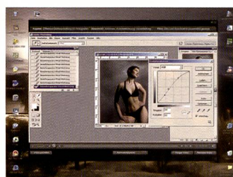
Schritt für Schritt wird die Bildbearbeitung nach dem Fashion Shooting erklärt.

Im zweiten Teil des Lehrgangs geht es dann darum, Arbeitsplatz und Monitor einzurichten, die RAW-Aufnahmen zu konvertie-