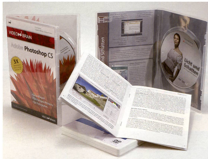
Weiterbildung ist alles. Manche lernen aus Büchern, eine jüngere Methode bedient sich der multimedialen DVD's.

Schon in der Schule merken wir, welcher Lerntyp wir sind. der Eine liest lieber, der Andere begreift beim Zuhören, der Dritte braucht Bilder. Für die letzteren beiden Lerntypen sind die Videotrainings auf DVD ideal, sei es für Fotokurse, Bildbearbeitung oder professionelles Farbmanagement.