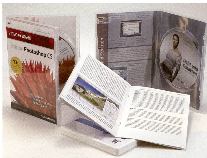
Weiterbildung ist alles. Manche lernen aus Büchern, eine jüngere Methode bedient sich der multimedialen DVD's.

Schon in der Schule merken wir, welcher Lerntyp wir sind. Der Eine liest lieber, der Andere begreift beim Zuhören, der Dritte braucht Bilder. Für die letzteren beiden Lerntypen sind die Videotrainings auf DVD ideal, sei es für Fotokurse, Bildbearbeitung oder professionelles Farbmanagement.