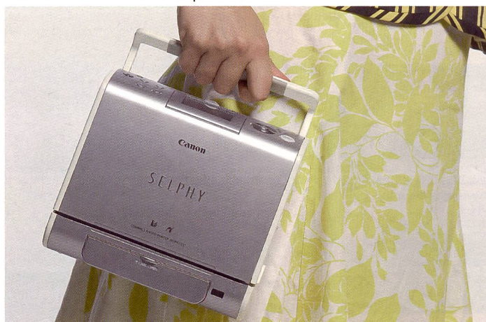
Der Canon Selphy ES1 wartet mit einer neuen Kombination von Folienkartusche und Printerpapier auf, die besonders einfach zu handhaben ist und bis zu 50 Prints beinhaltet. Er ist ab jetzt im Handel erhältlich und kostet CHF 358.-.

Wir haben schon vermehrt Marktübersichten von den aktuellen kleinen Fotodruckern gebracht (Fotointern 10/06). Nun haben wir das jüngste Modell der Canon-Familie, den an der Photokina präsentierten Selphy ES1 mal gründlich unter die Lupe genommen und Postkarten damit produziert.