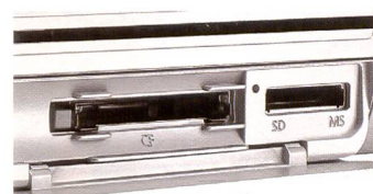
Der Selphy ES1 unterstützt die Formate Memory Stick (auch Pro), Microdrive, MMC, SD Card, CF Card und die neuen SDHC Card.

Leider liessen sich im Test nicht alle JPEG-Bildformate problemlos ausdrucken, bei den vom Macin-